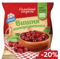
Вишня СЕМЕЙНЫЕ СЕКРЕТЫ, замороженная, без косточек, 300 г