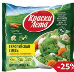
Смесь овощная КРАСКИ ЛЕТА, Европейская, замороженная, 400 г