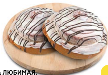
Сдоба ЛЮБИМАЯ , с начинкой заварной крем с корицей, 125 г