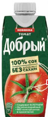
Сок ДОБРЫЙ, Томатный, 0,33 л

Купи 3 чебурека и получи скидку 33% на СОК!