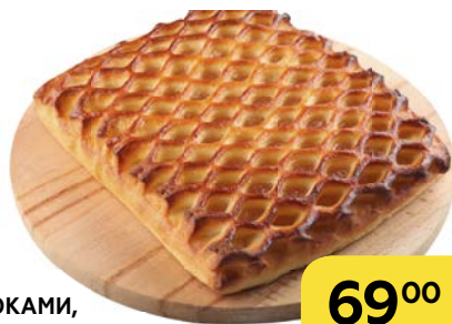
ПИРОГ С ЯБЛОКАМИ , 500 г