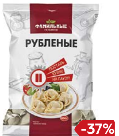
Пельмени РУБЛЕННЫЕ (Фамильные пельмени), 850 г