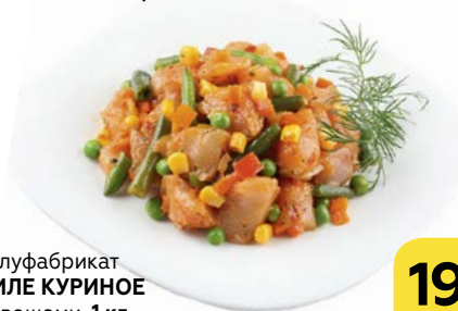
Полуфабрикат ФИЛЕ КУРИНОЕ с овощами, 1 кг