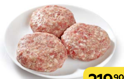
Полуфабрикат ШНИЦЕЛЬ По-французски, 1 кг