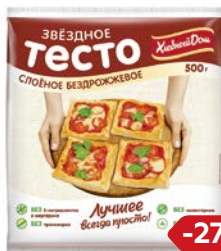
Тесто слоеное ЗВЕЗДНОЕ, Бездрожжевое (Фацер), 500 г