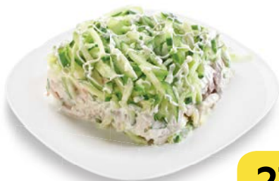
Салат ФАВОРИТ , 100 г