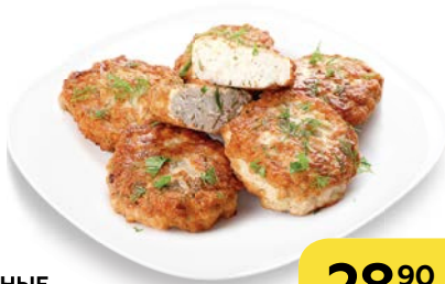
ОЛАДЫ КУРИНЫЕ , 100 г