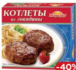
Котлеты МИРОЗКО, говядина, 330 г