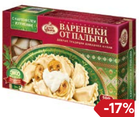
Вареники ОТ ПАЛЫЧА с картофелем и грибами, 500 г