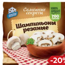
Шампиньоны СЕМЕЙНЫЕ СЕКРЕТЫ, Резаные, быстрозамороженные, 700 г