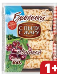
Блинчики С ПЫЛУ С ЖАРУ, с вишней, 360 г

* При покупке 3 одинаковых упаковок чебурек с мясом 125 г и сока «Добры» томатный 0,33л предоставляется скидка на сок 33% на кассе.