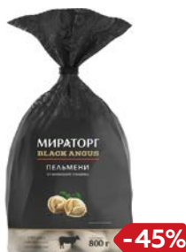
Пельмени МИРАТОРГ, Из мраморной говядины, 800 г

* Цена за единицу товара при одновременной покупке 2 одинаковых упаковок товара