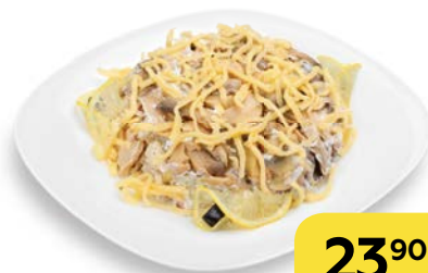
Салат ВИКИНГ , 100 г