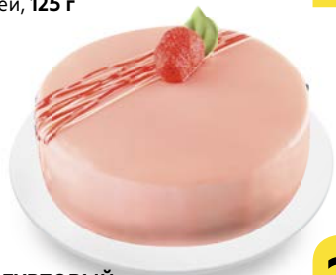
Торт ЙОГУРТОВЫЙ , бисквитный, 800 г