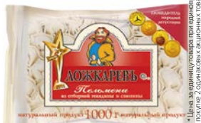
Пельмени ЛОЖКАРЕВЪ, Из отборной говядины-свинины (Шельф), 1кг