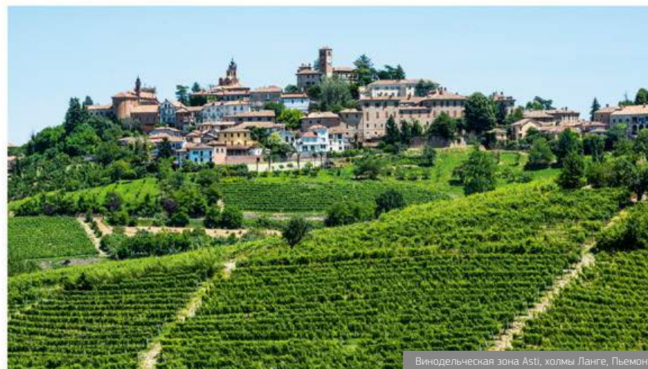
Винодельческая зона Asti, холмы Ланге, Пьемонт