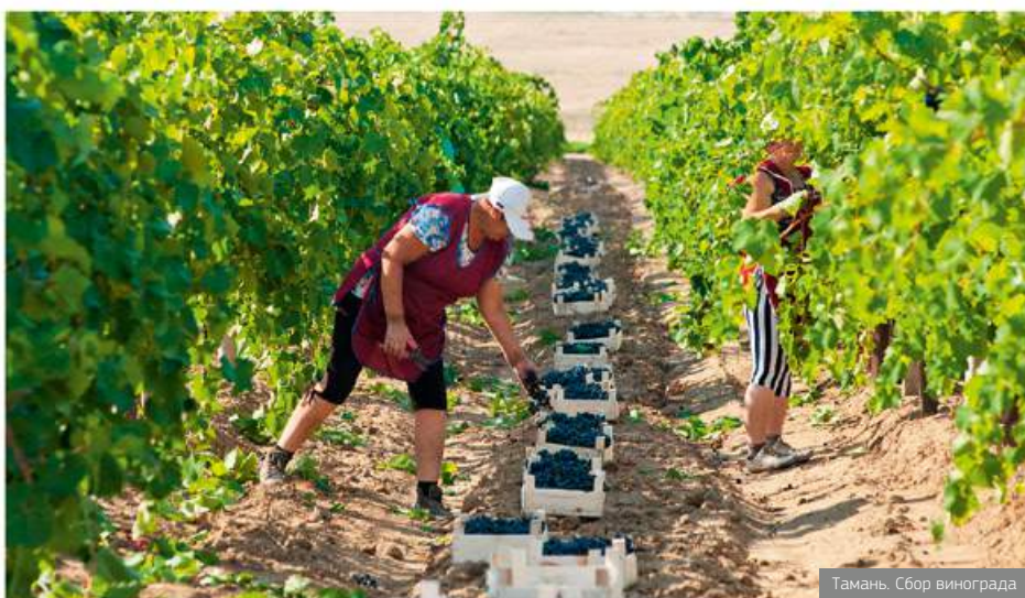
Тамань. Сбор винограда