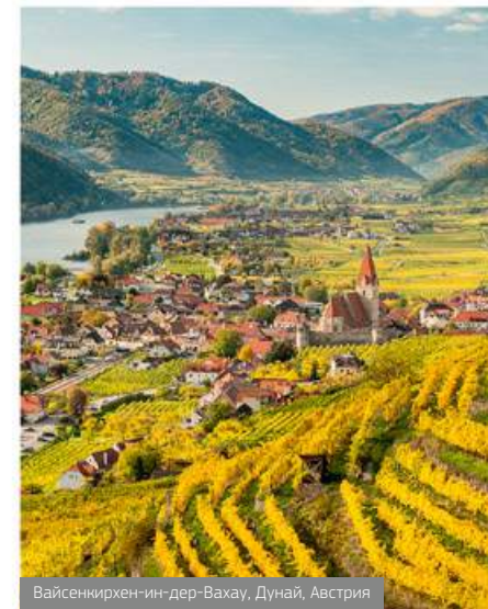
Вайсенкирхен-ин-дер-Ваху, Дунай, Австрия

В XX веке Австрия ассоциировалась со сладкими винами из сортов Грюнер Вельтлинер и Мюллер-Тургау. Сегодня австрийское виноделие переживает Ренессанс, производя хрустящие стильные, с большим потенциалом к выдержке, вина. Официально для производства вина в Австрии разрешены 35 сортов винограда, из которых почти две трети – белые. Лидером по популярности является Грюнер Вельтлинер, далее следует Рислинг. Вина из сорта Грюнер Вельтлинер обладают высокой ароматикой, в зависимости от места произрастания аромат может варьироваться от минерально-травянистого до богатого фруктового с тонами яблок, цитрусовых и экзотических фруктов. Благодаря высокой природной кислотности эти вина прекрасно сочетаются с салатами, рыбой и морепродуктами. В свою очередь, зрелые вина составят отличную пару белому и красному мясу. Из красных сортов особо популярны Цвейгельт, Блауфранкиш, Блаубургундер – он же Пино нуар. Австрийские законы о вине находят под сильным влиянием соседней Германии. Система классификации качества вина страны основана на содержании сахара в сусле.