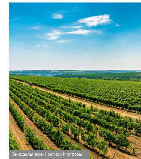
Винодельческий регион Молдовы