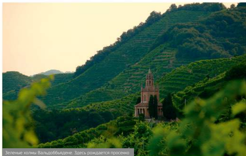
Зеленые холмы Вальдобьядене. Здесь рождается просекко

У шампанского существует более бюджетная альтернатива из Франции – Креман. Правила его производства похожи, но менее строгие, чем аналогичные предписания для шампанского – однако стоит учесть, что французское виноделие жестко регулируется, поэтому качество вина всегда на высоте. Креман изготавливают из собранных вручную ягод, причем урожайность участка строго контролируется и не должна превышать установленные нормы. Для газации используется традиционный метод вторичной ферментации (брожения) в бутылке, такой же, как при изготовлении шампанского.