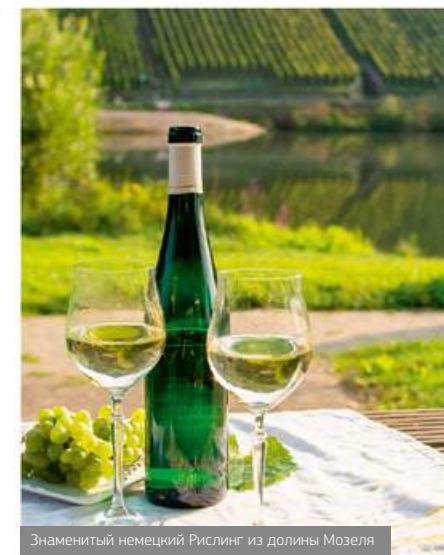
Знаменитый немецкий Рислинг из долины Мозеля