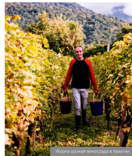
Уборка урожая винограда в Кахетии

Винное предприятие «Дом грузинского вина» было основано в 1996 г. в городе Гори, в левобережной виноградарской зоне реки Лиахви. Завод владеет виноградниками в Центральной и Западной Грузии, также виноград поставляется из Кахетии. Приемка, первичная переработка винограда, фильтрация и розлив вина производятся на новейшем оборудовании. В современной лаборатории проверяют качество на всех этапах производства. Особое внимание уделяется экологической чистоте вин. В 2006 году «Дом грузинского вина» открыл в Раче, в г. Амбролаури завод по приемке и переработке винограда. Рача – микрорайон, где произрастают такие удивительные сорта, как Александроиули и Муджуретули, из которых впоследствии производится «жемчужина» грузинских вин – Хванчкара. Вино различается как в стеклянные бутылки, так и в глиняные кувшины разной ёмкости. Линейка Картули Гвино, которую «Дом грузинского вина» специально производит для сети «Да!», представляет собой напитки высочайшего качества – лучшие образцы грузинского виноделия.