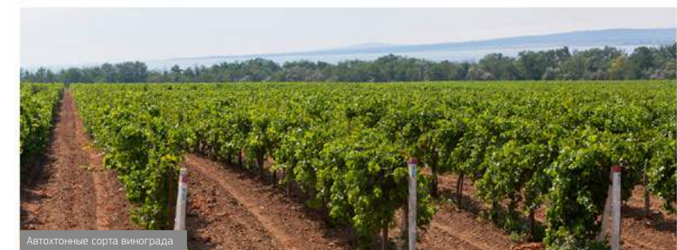
Автохтонные сорта винограда

Серия «Авторское вино» – коллекция эксклюзивных вин, созданных мастерами «Фанагории» по собственным рецептам. В основе купажей и моносортовых вин лежат классические и автохтонные сорта фанагорийского винограда. Виноделы подобрали их таким образом, чтобы с одной стороны подчеркнуть индивидуальные особенности, а с другой – гармонично расширить палитру вкусов и ароматов.