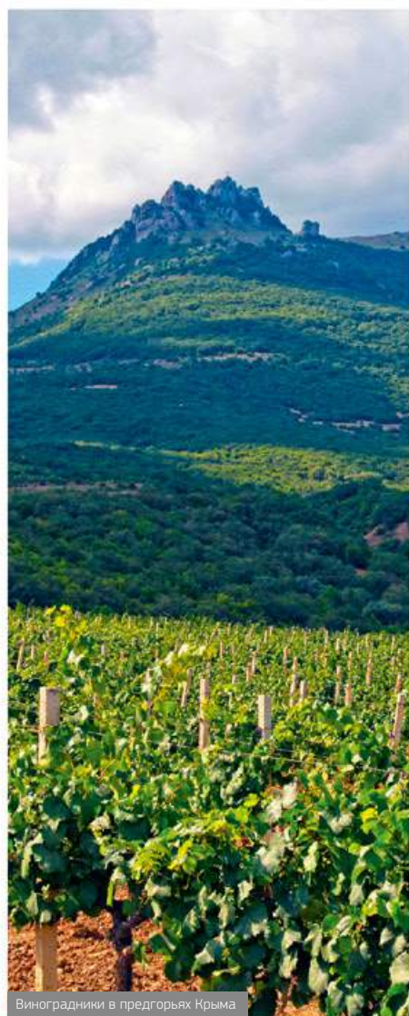
Виноградники в предгорьях Крыма

Кокур – местный сорт, который является визитной карточкой «Солнечной Долины». Вино из этого сорта обладает свежими фруктовыми ароматами. Старые лозы, ягоды с которых используют для создания этого вина, удивительно приспособлены к местным жарким и засушливым условиям. Кокур – настоящее выражение терруара. Лучшие гастрономические пары к нему могут составить летние салаты, морская рыба и морепродукты. Правильной идеей будет попробовать Кокур «Солнечной Долины» с блюдами дальневосточной кухни – суши, роллами, сашими.