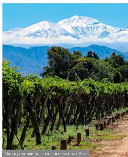
Виноградники на фоне заснеженных Анд

В начале XX века Мальбек был одним из наиболее активно возделываемых сортов в Европе, особенно во Франции. Однако после холодной зимы 1956 года, когда погибло более 75% лоз, популярность его сильно снизилась. В Европе он встречается крайне редко, в основном выращиваемый в регионе Каор (Франция), где согласно правилам апелласона его содержание в вине должно быть не менее 70%. Основным же производителем винограда Мальбек сегодня является Аргентина. Он был завезен французскими виноделами в 1853 году, и сегодня этому сорту отдано около 50 000 га виноградников. В соседнем Чили его посадки занимают 6 000 га, тогда как во всей Франции – лишь около 5 500 га. Аргентинский Мальбек более насыщенный, фруктовый, с джемовыми нотками – тогда как французский вид более грубый, танинный. Мальбек прекрасно подходит к темному мясу птицы, жареной свинине и стейкам из говядины и дичи, а также хорошо сочетается с голубым и другими острыми и мягкими сырами.