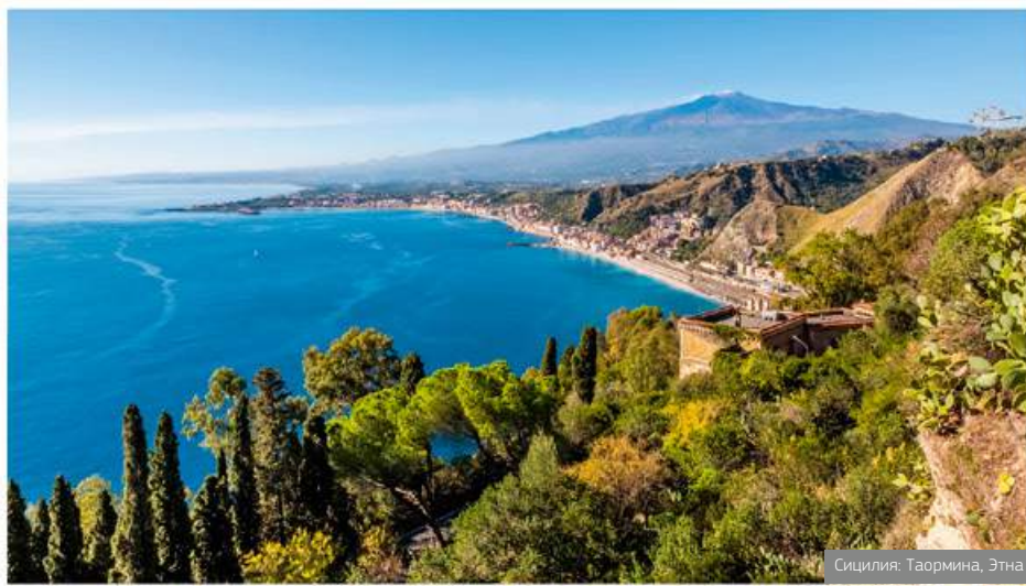
Сицилия: Таормина, Этна