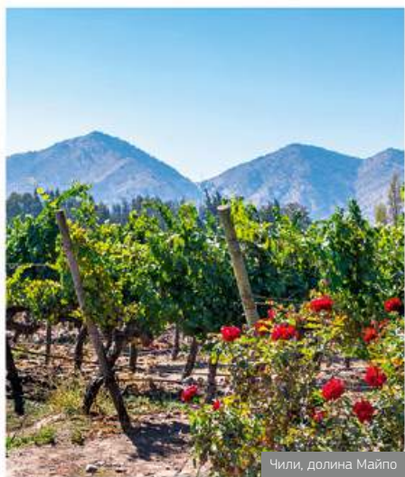
Чили, долина Майло