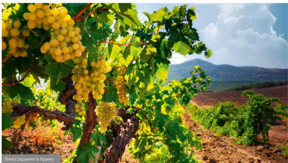
Виноградники в Крыму

Виноделие Крыма берет свое начало еще во времена древнегреческих поселений на территории полуострова. Одни из первых винокурен Крыма были построены греками ещё в древнем Херсонесе. Значительный ущерб крымскому виноделию принесло постановление «О борьбе с пьянством и алкоголизмом» в 1985 году, когда было уничтожено множество виноградников. В наше время наблюдается бурное развитие виноделия полуострова, а некоторые крымские производители получили всемирную известность, например «Солнечная Долина» и «Золотая Балка». Появление капельного орошения в засушливом климате региона открыло новые перспективы развития отрасли. Практически все новые посадки закладывают, снабжая системой капельного полива. Климат, словно специально созданный для выращивания винограда, геополитическое расположение на перекрестке торговых и туристических путей стали определяющими факторами для возрождения местного виноделия. Сегодня в республике настоящий бум терруарного виноделия, которое успешно развивается наряду с крупными предприятиями.