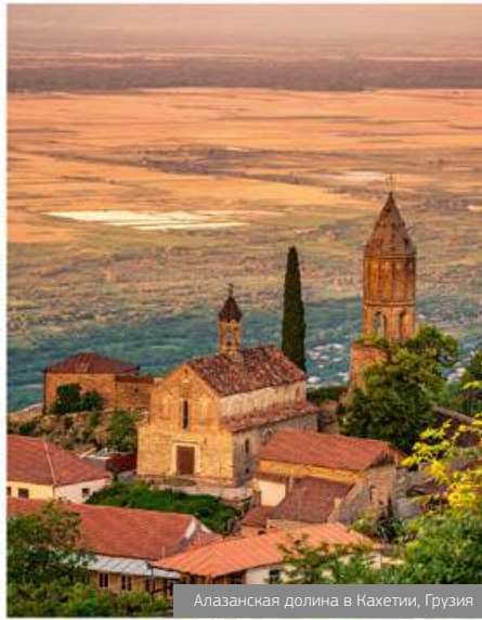
Алазанская долина в Кахетии, Грузия