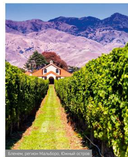
Бленем, регион Мальборо, Южный остров

Прежде чем завоевать мировую известность как значимый винодельческий регион, Новая Зеландия претерпела много взлетов и падений. Но именно этот непростой путь помог новозеландцам поднять качество своих вин до мирового уровня и даже потеснить с пьедестала многие известные европейские напитки.