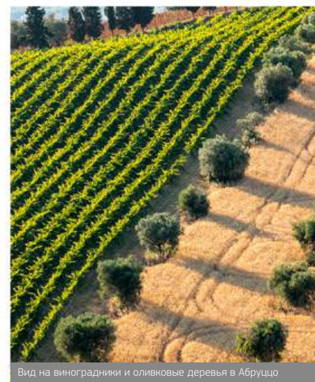
Вид на виноградники и оливковые деревья в Абрुццо