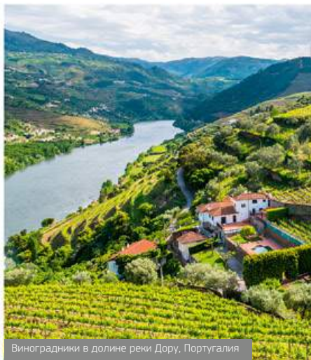
Виноградники в долине реки Дору, Португалия

Виноград Лоуреиру, Тражадура, Аринту Цвет Ярко-соломенный Аромат С нотами зелёных яблок, цитрусовых фруктов и свежескошенной травы Вкус Легкий, сбалансированный, с хрустящей кислотностью и нотами яблок