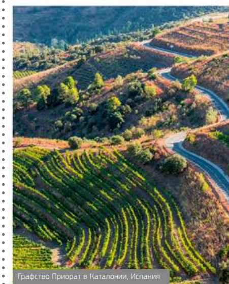
Графство Приорат в Каталонии, Испания

Кооператив объединяет 140 хозяйств, а общая площадь виноградников составляет 140 гектаров. Хозяйствами управляют фермеры, являющиеся виноделами во многих поколениях. Они как никто другой знают как управляться с уникальными виноградниками, бороться с болезнями наподобие филлоксеры и получать вино высочайшего качества.