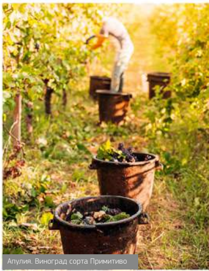
Апулия. Виноград сорта Примитиво

Выдерживается в дубовых бочках в течение 12 месяцев