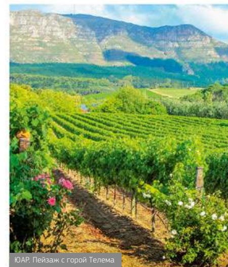
ЮАР, Пейзаж с горой Телема