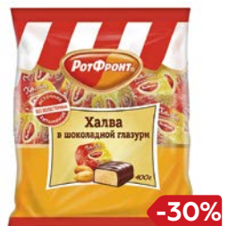
Конфеты ХАЛВА В шоколадной глазури (Рот Фронт), 400 г