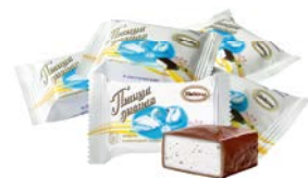
Конфеты ПТИЦА ДИВНАЯ, 100 г