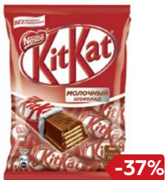
Конфеты КИТ КАТ молочный шоколад, 169 г