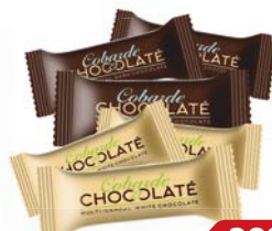
Конфеты КОБАРДЕ ЭЛЬ ШОКОЛАД Злаковые: В тёмном шоколаде/ В белом шоколаде, 100 г