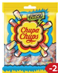
Мармелад жевательный ЧУПА-ЧУПС, С фруктовым вкусом, 150 г