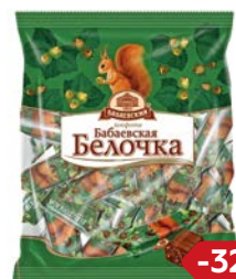
Конфеты БЕЛОЧКА (Бабаевский), 200 г