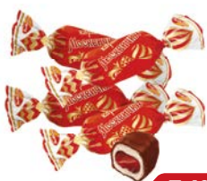
Карамель МОСКВИЧКА (Рот Фронт), 100 г