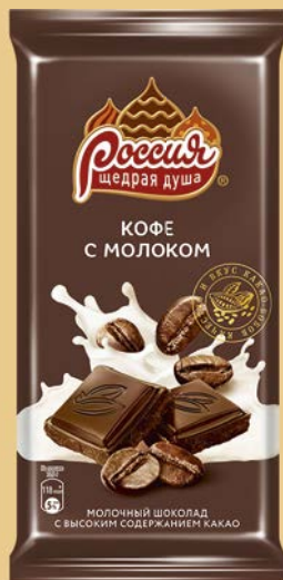
Шоколад РОССИЯ, В ассортименте***, 90 г/ 82 г