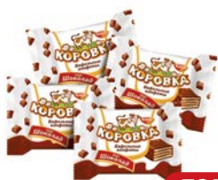
Конфеты вафельные КОРОВКА, шоколадные (Рот Фронт), 100 г