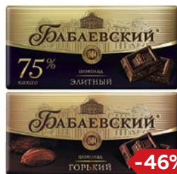
Шоколад БАБАЕВСКИЙ, в ассортименте***, 100 г