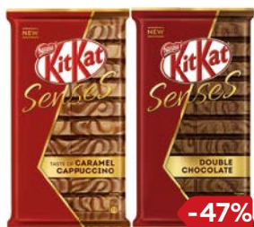
Шоколад КИТ КАТ, Сенсис: Молочный-тёмный с вафлей/ Белый, кокос-миндаль с вафлей/ Белый-молочный, капучино-карамель, 112 г