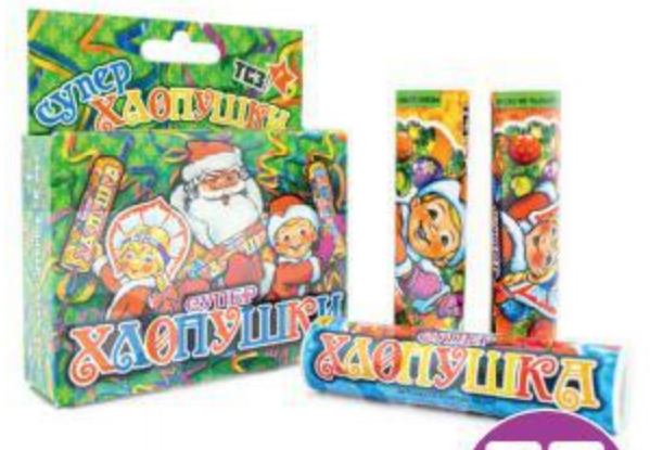
Набор хлопушек, 3 шт.