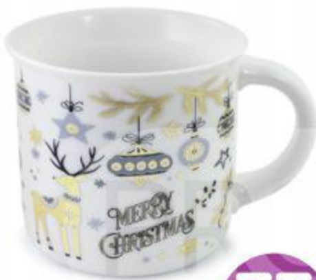
Кружка новогодняя, 400 мл В АССОРТИМЕНТЕ