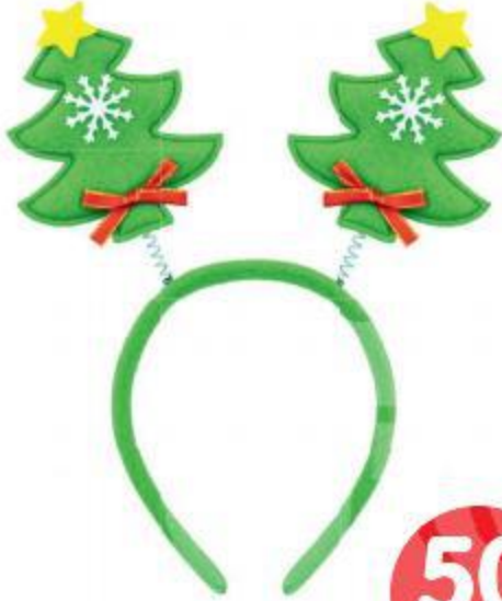
Ободок новогодний В АССОРТИМЕНТЕ

ПОДРОБНАЯ ИНФОРМАЦИЯ И УСЛОВИЯ НА САЙТЕ FIX-PRICE.RU