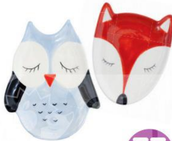
Тарелка новогодняя, 20x15x2 см В АССОРТИМЕНТЕ