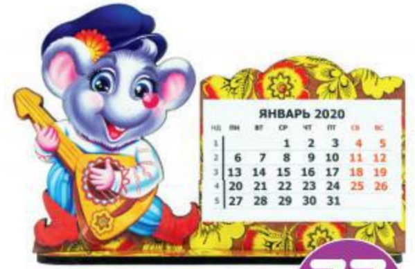
Календарь с отрывным блоком, 17x11 см В АССОРТИМЕНТЕ