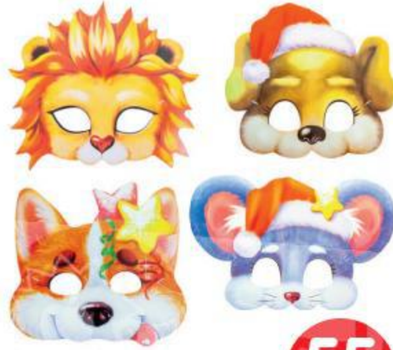
Набор картонных масок, 4 шт.