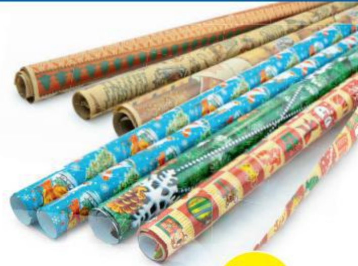
Бумага для упаковки подарка, 70x100 см В АССОРТИМЕНТЕ