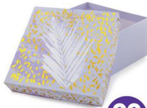
Коробка подарочная, 19x19x10 см