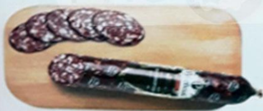
Колбаса «БРАУНШВЕЙГСКАЯ» сырокопчёная