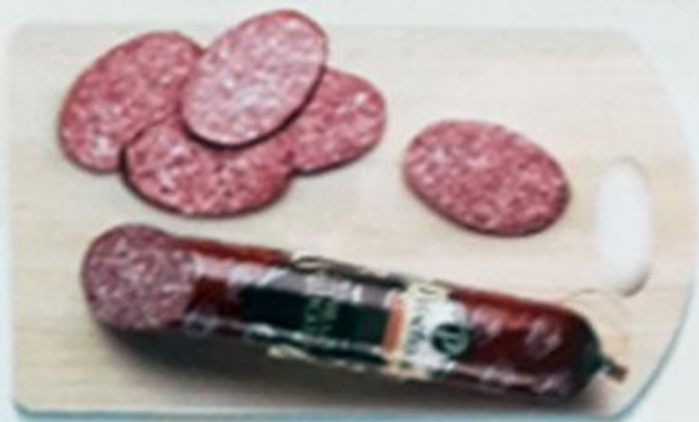
Колбаса «СЕРВЕЛАТ ФИНСКИЙ»