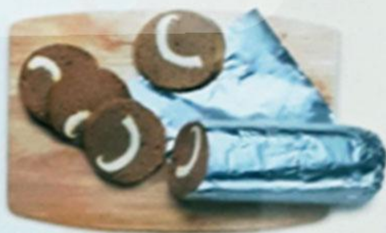
Паштет «ПЕЧЁНОЧНЫЙ» мясной