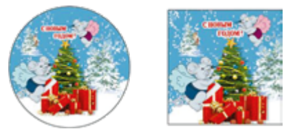
МАГНИТ МЫШОНОК 6 см 1 шт.