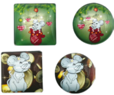
МАГНИТ МЫШКА 1 шт.