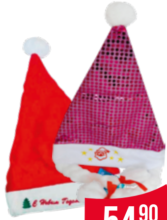
КОЛПАК Новогодний 1 шт.