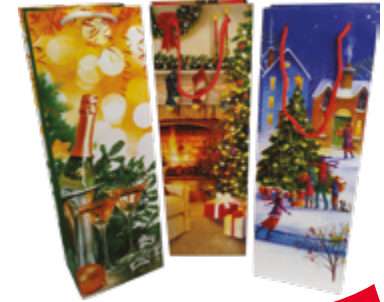
СУМКА БУМАЖНАЯ Новогодняя 1 шт.