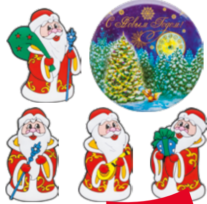
МАГНИТ «С НОВЫМ ГОДОМ!» 55*55*03 мм 1 шт.