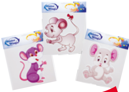
НАКЛЕЙКА декоративная МЫШКА 20x20 см 1 шт.