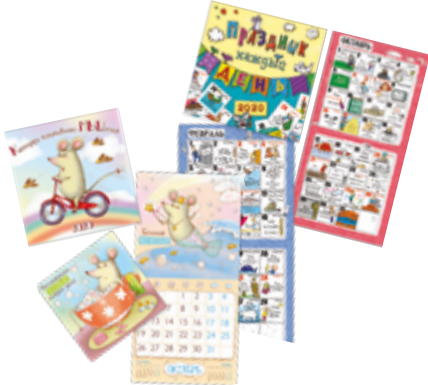
КАЛЕНДАРЬ новогодний скрепка 29*29 см 1 шт.