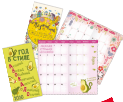
ЗАПИСНАЯ КНИЖКА ежедневник 1 шт.