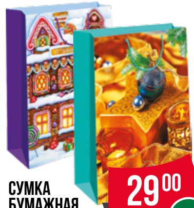
СУМКА БУМАЖНАЯ Новогодняя 1 шт.