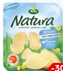
Сыр НАТУРА, Сли- вочный, легкий, нарезка, 150 г