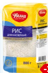
Рис УВЕЛКА , длиннозерный, классический, 800г