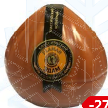
Сыр ФЛАМАН Эдам копченый, 100 г