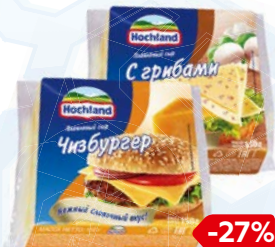
Сыр плавленый ХОХЛАНД, В ассортименте***, 150 г