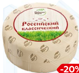
Сыр РОССИЙСКИЙ, Классический (Радость вкуса), 100 г