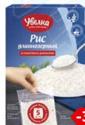
Рис УВЕЛКА , Длиннозерный, шлифованный, 5 пакетиков x 80г