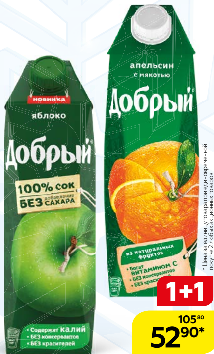
Соки и нектары ДОБРЫЙ , в ассортименте***, 1л