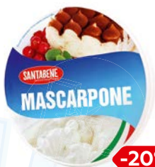
Сыр МАСКАРПОНЕ, Сантабене, 250 г