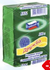
Продукт плавленый ДРУЖБА (Рязанский ЗПС), 100 г