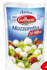
Сыр моцарелла ГАЛЬБАНИ, шарики, мини, 150 г