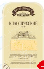
Сыр БРЕСТ-ЛИТОВСК, Классический, 45%, нарезка, 150 г