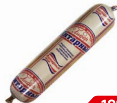
Сыр ЯНТАРНЫЙ Лидер, колбасный, копченый, 350 г