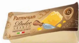
Сыр ПАРМЕЗАН Дольче, 200 г