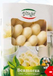
Сыр ВИТАЛАТ, Скаморца, 130 г