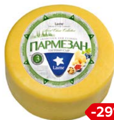
Сыр ЛАИМЕ, Пар- мезан, молодой, 100 г