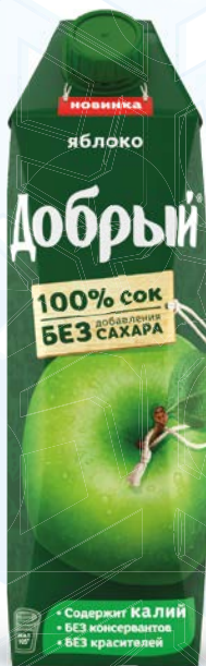
Соки и нектары ДОБРЫЙ , в ассортименте***, 1л