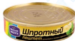
ПАШТЕТ шпротный, 160 г