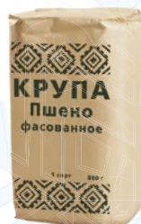
Крупа ПШЕНО , 800 г