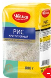
Рис круглозерный УВЕЛКА , Краснодарский, 800 г