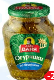
Огурчики ДЯДЯ ВАНЯ , По-берлински, 680 г