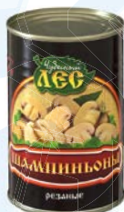
Шампиньоны ЧУДЕСНЫЙ ЛЕС , Консервированные, резаные, 400 г