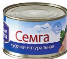
СЕМГА Натуральная , кусочки, 230 г