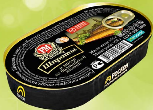
Шпроты РЫБНОЕ МЕНЮ в масле, 175 г