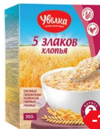
Хлопья УВЕЛКА , 5 злаков, 350 г