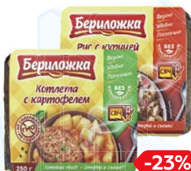
БЕРИЛОЖКА Обед готовый, Рис с курицей и овощами/ Котлета с картофелем, 250 г