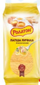
Лапша РОЛЛТОН , Яичная, Классическая, 400 г