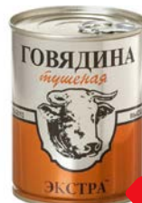
ГОВЯДИНА Экстра, тушеная (Русь), 338 г