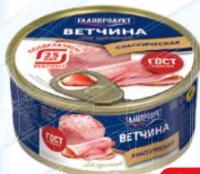
Ветчина ГЛАВПРОДУКТ , ГОСТ (Орелпродукт), 325 г