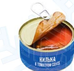
Консервы рыбные КИЛЬКА в томатном соусе, 230 г