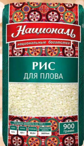
Рис НАЦИОНАЛЬ , Для плова/ Золотистый, 900 г