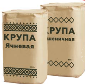
Крупа ПЕРЛОВАЯ/ЯЧНЕВАЯ/ПШЕНИЧНАЯ , 800 г