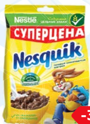
Завтрак готовый НЕСКВИК , Шарик шоколадные, 250 г