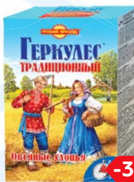
Хлопья овсяные ГЕРКУЛЕС Традиционный, 500 г