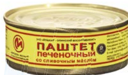
Паштет ПЕЧЕНОЧНЫЙ , со сливочным маслом, ГОСТ (Йошкар-Олинский МК), 100 г