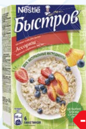
Каша овсяная БЫСТРОВ , Ассорти: Черника, клубника, персик, 6 пакетиков x 40 г