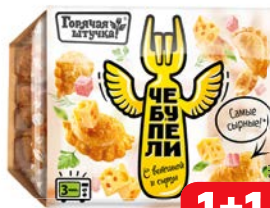
Чебуречки ГОРЯЧАЯ ШТУЧКА, С ветчи- ной и сыром, 300 г