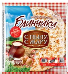
Блинчики С ПЫЛУ С ЖАРУ, без начинки, 360г