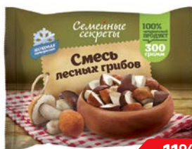
Смесь лесных гри- бов СЕМЕЙНЫЕ СЕКРЕТЫ, 300г