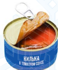
Консервы рыбные КИЛЬКА в томат- ном соусе, 230 г