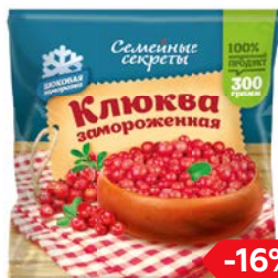
Клюква СЕМЕЙНЫЕ СЕКРЕТЫ, заморо- женная, 300г