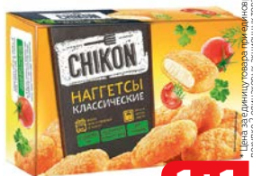
Наггетсы ЧИКОН Классические, 300 г

* Цена за единицу товара при единовременной покупке 2 одинаковых акционных товаров