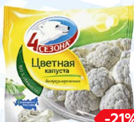
Капуста цветная 4 СЕЗОНА, 400г