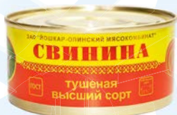
СВИНИНА ТУШЕНАЯ, ГОСТ (ИюшкарОлинский МК), 325 г