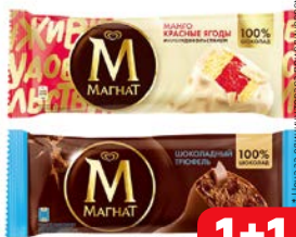
Мороженное МАГНАТ, Эскимо: Шоколадный три- фель, 72 г; Миндаль, 73 г; Манго-красные ягоды, 70 г