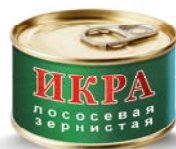
ИКРА КРАСНАЯ, 95г

* Цена за единицу товара при единовременной покупке 2 одинаковых акционных товаров