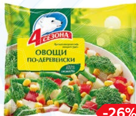
Смесь овощная 4 СЕЗОНА, Овощи по-деревенски, заморожен- ные, 400 г