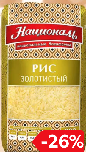
Рис НАЦИОНАЛЬ , Для плова/ Золотистый, 900 г