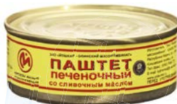
Паштет ПЕЧЕНОЧНЫЙ , со сливочным маслом, ГОСТ (Июшкар-Олинский МК), 100 г