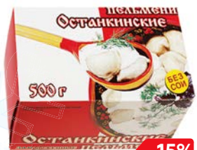
Пельмени ОСТАНКИНСКИЕ (ОМПК), 500 г