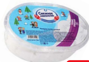
Мороженое СНЕЖНОЕ ЛАКОМСТВО, Пломбир, 12%, 500 г

* Цена за единицу товара при единовременной покупке 2 одинаковых акционных товаров