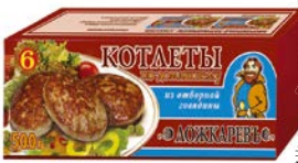
Котлеты ЛОЖКАРЕВЪ, по-домашнему, говядина (Шельф), 500 г

* Цена за единицу товара при единовременной покупке 2 одинаковых акционных товаров