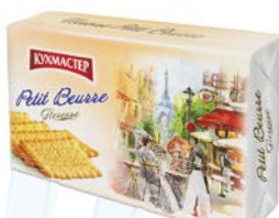
Печенье КУХМАСТЕР, Петит Берр, 420 г