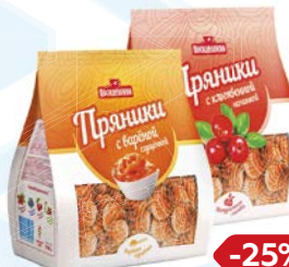
Пряники ПОСИДЕЛКИНО, С клюквой/ С вареной сгущен- кой, 300 г