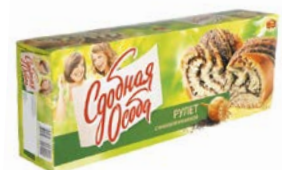
Рулет СДОБНАЯ ОСОБА, С маковой начинкой, 400 г