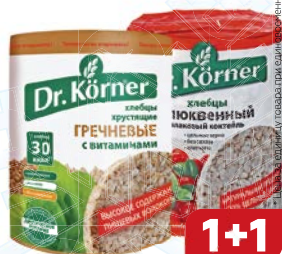
Хлебцы DR.KORNER®, Греч- невые, с витаминами/ Злаковый коктейль, клубка, 100 г