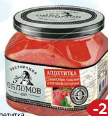
Аппетитка РЕСТОРАЦИЯ ОБЛОМОВ С Бакинскими тома- тами и перчиком лепперони, 420 г