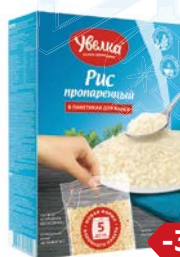
Рис УВЕЛКА , Длиннозерный пропаренный, 5 пакетиков x 80 г