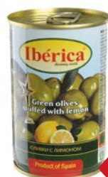
Оливки ИБЕРИКА , Зеленые с лимо- ном, 300 г