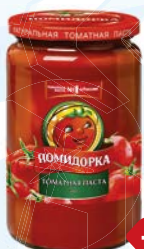
Паста томатная ПОМИДОРКА , 480 мл