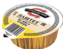
Паштет СТОЛЕТОВСКИЙ из мяса птицы, 95 г