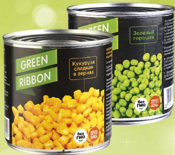
GREEN RIBBON® , Горошек зеленый, 400 г/ Кукуруза, 340 г