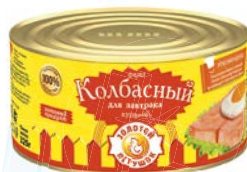
Фарш куриный КОЛБАСНЫЙ , Для завтрака (Золотой петушок), 325 г