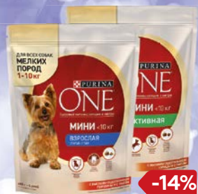
Корм сухой для собак мелких пород PURINA ONE® , Взрослая, говядина-рис/ Активная, курица-рис, 600 г