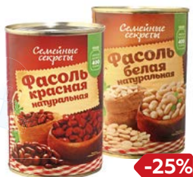
Фасоль СЕМЕЙНЫЕ СЕКРЕТЫ , Красная/ Белая, 400 г