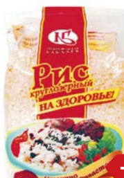
Рис НА ЗДОРОВЬЕ , Круглозерный, 800 г