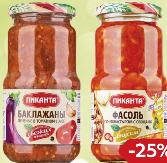
ПИКАНТА , Баклажаны печеные в томатном соусе, 520 г; Фасоль по-монастырски, 530 г