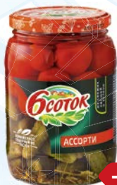
Ассорти 6 СОТОК , Черри, корн- шоны, 680 г