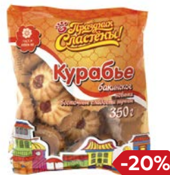
Печенье ПРАЗДНИК СЛАСТЕНЫ, Курабье, 350 г