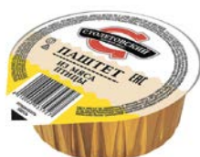
Паштет СТОЛЕТОВСКИЙ из мяса птицы, 95 г