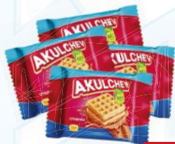
Вафли венские АКУЛЬЧЕВ, Сгущенка, 50 г