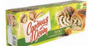
Рулет СДОБНАЯ ОСОБА, С маковой начинкой, 400 г