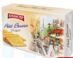
Печенье КУХМАСТЕР, Петит Берр, 420 г