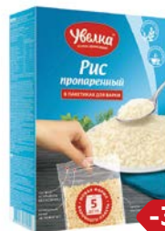
Рис УВЕЛКА , Длиннозерный пропаренный, 5 пакетиков x 80 г