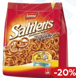
Крендель СОЛТЛЕТТС, с солью (Лоренц), 150 г