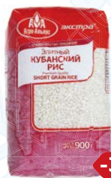
Рис ЭКСТРА , Кубанский, Элит- ный (Агро-Альянс), 900 г