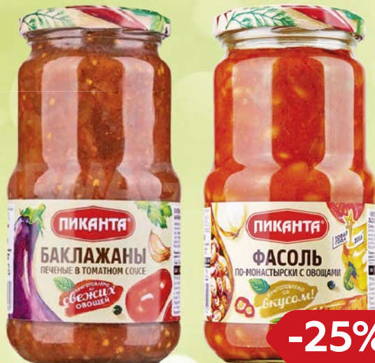
ПИКАНТА , Баклажаны печеные в томатном соусе, 520 г; Фасоль по-монастырски, 530 г