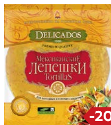
Лепешки ТОРТИЛЬЯС, Мексиканские, пшеничные сырные (Солнце Мехико), 400 г