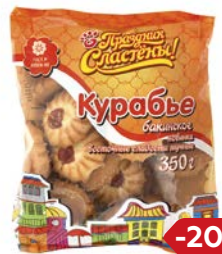
Печенье ПРАЗДНИК СЛАСТЭНЫ, Курабье, 350 г