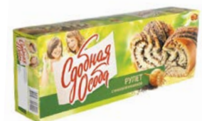
Рулет СДОБНАЯ ОСОБА, С маковой начинкой, 400 г