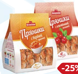
Пряники ПОСИДЕЛКИНО, С кленовой/ Свареной сгущенкой, 300 г