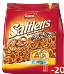
Крендель СОЛТЛЕТТС, с солью (Лоренц), 150 г