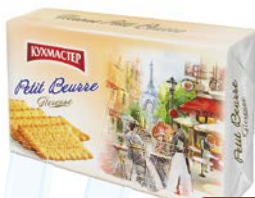
Печенье КУХМАСТЕР, Петит Берр, 420 г