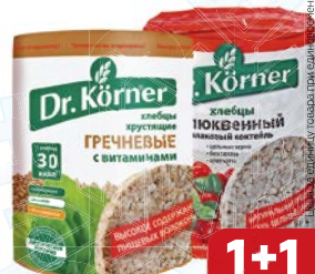
Хлебцы DR.KORNER®, Гречневые, с витаминами/ Злаковый коктейль, клявка, 100 г