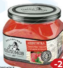
Аппетитка РЕСТОРАЦИЯ ОБЛОМОВ С Бакинскими тома- тами и перчиком лепперони, 420 г