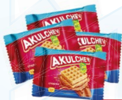
Вафли венские АКУЛЬЧЕВ, Сгущенка, 50 г