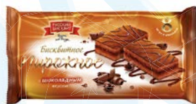
Пирожное РУССКИЙ БИСКВИТ, С шоколадным вкусом, 240 г