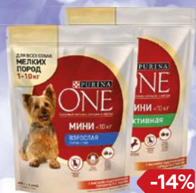
Корм сухой для собак мелких пород PURINA ONE® , Взрослая, говядина-рис/ Активная, курица-рис, 600 г