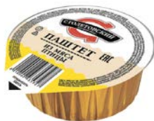
Паштет СТОЛЕТОВСКИЙ из мяса птицы, 95 г