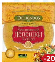
Лепешки ТОРТИЛЯС, Мексиканские, пшеничные сырные (Солнце Мехико), 400 г