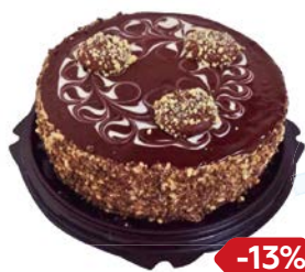
Торт КАРАМЕЛЬНАЯ ФАНТАЗИЯ (Академия вкуса), 600 г