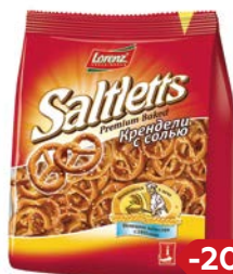
Крендель СОЛТЛЕТТС, с солью (Лоренц), 150 г