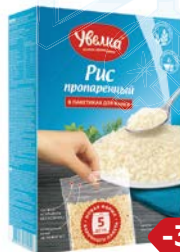
Рис УВЕЛКА , Длиннозерный пропаренный, 5 пакетиков x 80 г