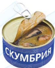
СКУМБРИЯ С добавлением масла, 250 г