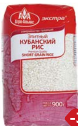
Рис ЭКСТРА , Кубанский, Элит- ный (Агро-Альянс), 900 г