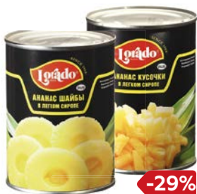
Ананасы ЛОРАДО , Шайбы/ Кусочки, 580 мл