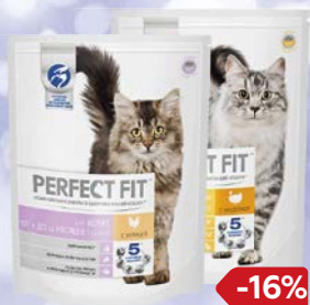
Корм сухой PERFECT FIT® , В ассортименте***, 650 г