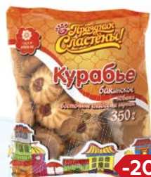
Печенье ПРАЗДНИК СЛАСТЕНЫ, Курabye, 350 г