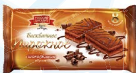
Пирожное РУССКИЙ БИСКВИТ, С шоколадным вкусом, 240 г