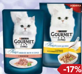
Корм для кошек GOURMET® , Перл, соус де-люкс: Говя- дина/ Курица/ Лосось в подливе, 85 г