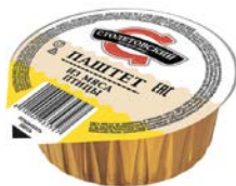
Паштет СТОЛЕТОВСКИЙ из мяса птицы, 95 г