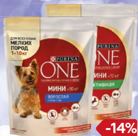
Корм сухой для собак мелких пород PURINA ONE® , Взрослая, говядина-рис/ Активная, курица-рис, 600 г