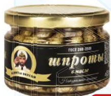
Шпроты КАПИТАН ВКУСОВ в масле, 250 г