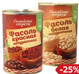
Фасоль СЕМЕЙНЫЕ СЕКРЕТЫ , Красная/ Белая, 400 г