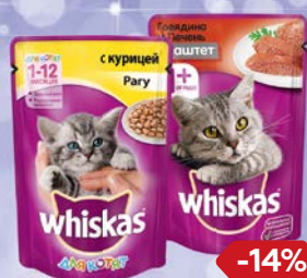
Корм для кошек WHISKAS® , В ассортименте***, 85 г