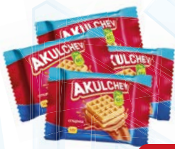
Вафли венские АКУЛЬЧЕВ, Сгущенка, 50 г