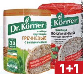
Хлебцы DR.KORNER®, Гречневые, с витаминами/ Злаковый коктейль, кюльва, 100 г