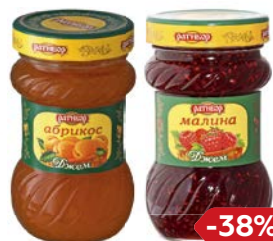
Джем РАТИБОР Малина/ Абрикос, 360 г