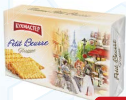
Печенье КУХМАСТЕР Petit Beurre, Петит Берр, 420 г