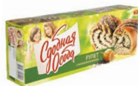
Рулет СДОБНАЯ ОСОБА, С маковой начинкой, 400 г