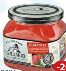
Аппетитка РЕСТОРАЦИЯ ОБЛОМОВ С Бакинскими тома- тами и перчиком лепперони, 420 г