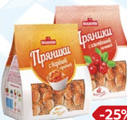
Пряники ПОСИДЕЛКИНО, С клюквой/ С вареной сгущен- кой, 300 г