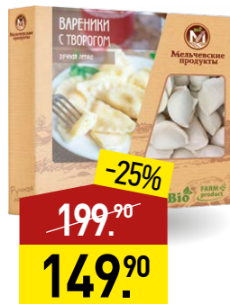
Вареники МЕЛЬЧЕВСКИЕ ПРОДУКТЫ с творогом, 400 г