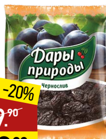
Чернослив ДАРЫ ПРИРОДЫ сушеный, 6/к, 150 г