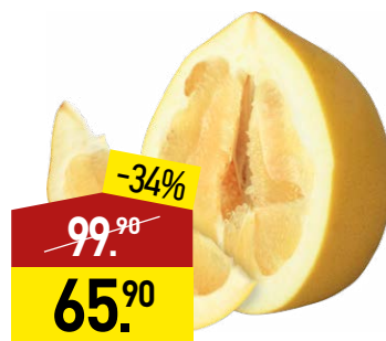
Помело 1 кг