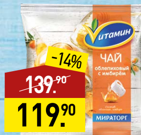
Чай ВИТАМИН облепиховый, с имбирем, 300 г, МИРАТОРГ