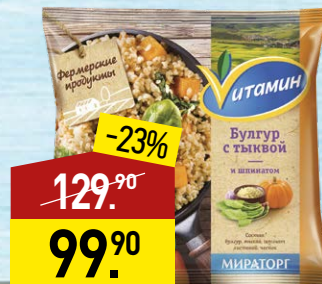
Булгур ВИТАМИН Фермерские продукты, с тыквой и шпинатом, 400 г, МИРАТОРГ