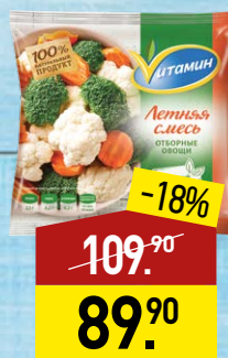
Смесь ВИТАМИН Летняя, овощная, 400 г, МИРАТОРГ