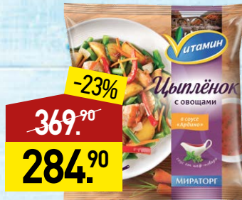
Цыпленок ВИТАМИН с овощами в соусе Ардино, 600 г, МИРАТОРГ