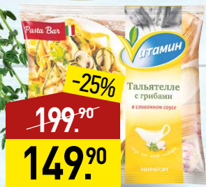
Тальятелле ВИТАМИН с грибами, в сливочном соусе, 400 г, МИРАТОРГ