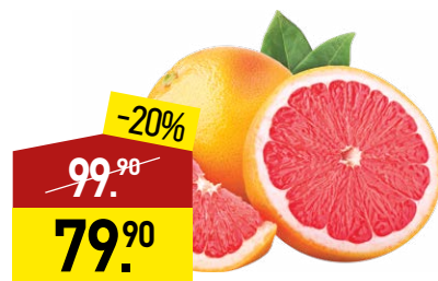
Грейпфрут красный 1 кг (Турция)