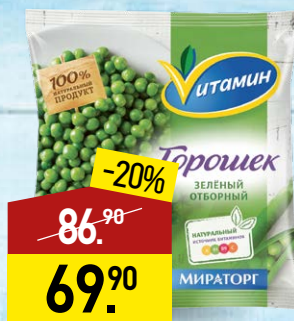
Горошек зеленый ВИТАМИН 8-9 мм, 400 г, МИРАТОРГ