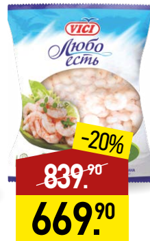
Креветки VICI Салатные, очищенные, 200/300, 500 г