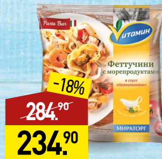
Феттучини ВИТАМИН с морепродуктами в соусе Неаполитано, 400 г, МИРАТОРГ