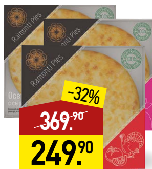
Пирог осетинский RAMONTI PIES в ассортименте, 500 г