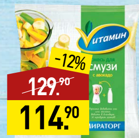
Смесь для смузи ВИТАМИН с авокадо, 250 г, МИРАТОРГ