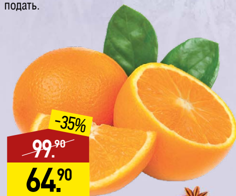
Апельсины 1 кг

Прогреть на слабом огне до температуры 80 °С. Не давать кипеть! Готовый напиток разлить по высоким бокалам и немедленно подать.