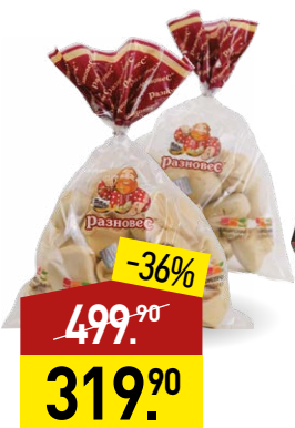
Манты; хиңкалы СИБИРСКИЙ ДЕЛИКАТ Машины, 820-840 г