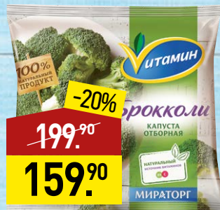
Брокколи ВИТАМИН 20-40 мм, 400 г, МИРАТОРГ