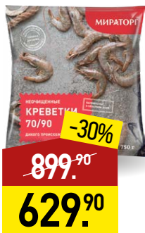
Креветки ВИТАМИН неочищенные, 70/90, 750 г, МИРАТОРГ