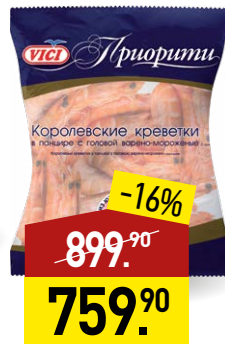
Креветки VICI Королевские, в панцире, в/м, 50/70, 1 кг