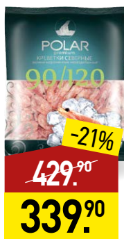
Креветки POLAR 90/120, 500 г