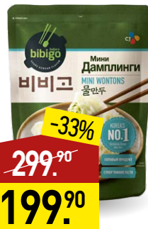
Дамплинги BIBIGO Королевские, из свинины, 385 г