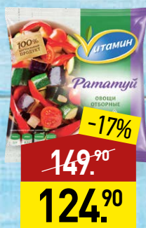
Рататуй ВИТАМИН 400 г, МИРАТОРГ