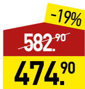
Огузок говядина Black Angus, 800 г, МИРАТОРГ *Блэк Ангус