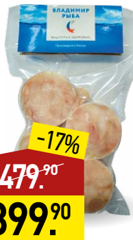
Хек ВЛАДИМИР РЫБА филе, с/м, 500 г