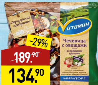
Чечевица ВИТАМИН Фермерские продукты, с овощами и пряными травами, 400 г, МИРАТОРГ