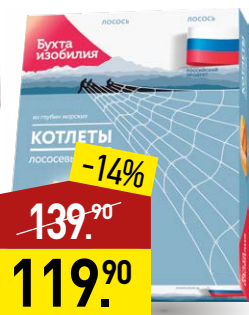
Котлеты БУХТА ИЗОБИЛИЯ лососевые, в панировке, 320 г