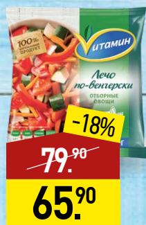
Лечо ВИТАМИН По-венгерски, 400 г, МИРАТОРГ