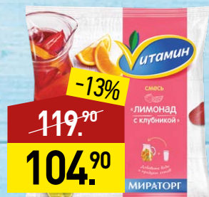
Смесь ВИТАМИН Лимонад с клубникой, 250 г, МИРАТОРГ