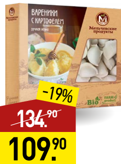
Вареники МЕЛЬЧЕВСКИЕ ПРОДУКТЫ с картофелем, 400 г