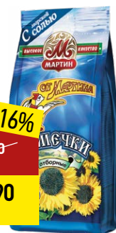
Семечки ОТ МАРТИНА черные, с морской солью, 100 г