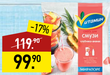
Смесь для смузи ВИТАМИН клубника-ананас, 300 г, МИРАТОРГ