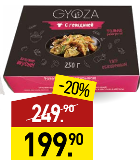
Пельмени VICI Gyoza, с говядиной, обжаренные, 250 г