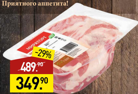
Шейка свиная 6/к, 1 кг, МИРАТОРГ