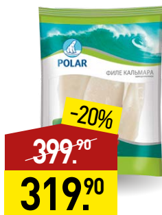
Филе кальмара POLAR 500 г