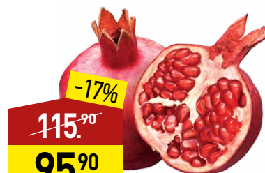
Гранаты 1 кг (Турция)