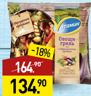
Овощи-гриль ВИТАМИН Фермерские продукты, с итальянскими травами, 400 г, МИРАТОРГ