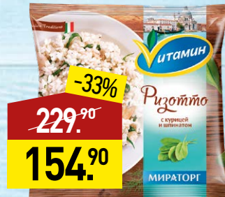
Ризотто ВИТАМИН с курицей и шпинатом, 400 г, МИРАТОРГ