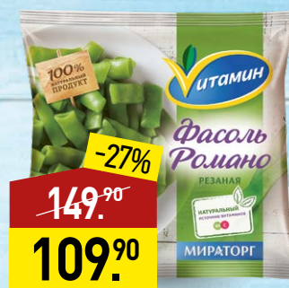
Фасоль ВИТАМИН Романо, 400 г, МИРАТОРГ

Изображения товаров могут отличаться от представленных в магазине. Все товары имеют несоборные сертификаты. Цена указана в рублях за единицу товара. Скидка не суммируется с льготами. Информация о товарах - участниках акции уточняйте у кассира. Количество товаров ограничено. Товары расставляются в соответствии с ассортиментом «Мираторг». Реклама.