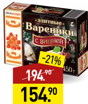
Вареники ОТ ИЛЬИНОЙ Элитные, с вишней, 450 г