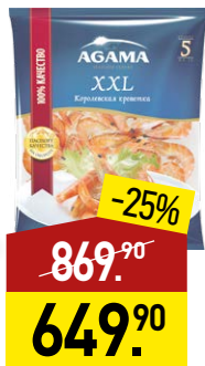
Креветка АГАМА Королевская №5, XXL, неразделанная, в/м, 700 г