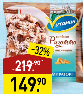
Ризотто ВИТАМИН грибное, с лисичками, 400 г, МИРАТОРГ