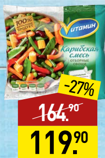
Смесь ВИТАМИН Карибская, 400 г, МИРАТОРГ