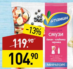
Смесь ВИТАМИН для смузи, банан-клубника-черника, 270 г, МИРАТОРГ