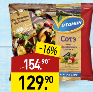
Сотэ ВИТАМИН Фермерские продукты, с прованскими травами, 400 г, МИРАТОРГ