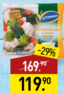
Смесь ВИТАМИН Бельгийская, 400 г, МИРАТОРГ