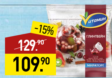
Глинтвейн ВИТАМИН 300 г, МИРАТОРГ