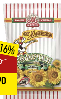
Семечки ОТ МАРТИНА белые, соленые, 100 г