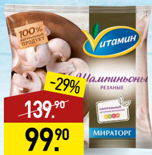
Шампиньоны ВИТАМИН резаные, 400 г, МИРАТОРГ