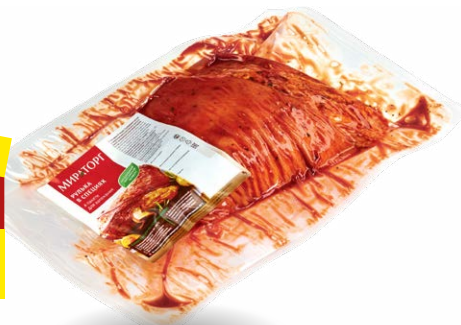
Окорок Дворянский свиной, в брусничном соусе, без кости, в пакете для запекания, 1 кг, МИРАТОРГ