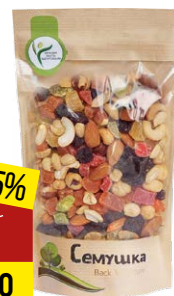
Смесь СЕМУШКА сладкая, орехи-цукаты, 150 г