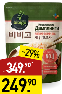
Дамплинги BIBIGO Королевские с креветками, 385 г