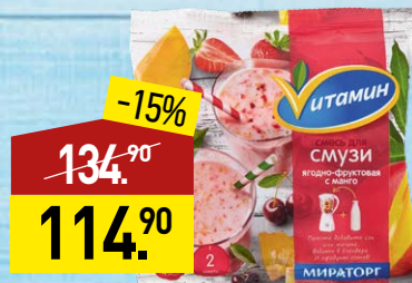
Смесь для смузи ВИТАМИН ягодно-фруктовая, с манго, 300 г, МИРАТОРГ