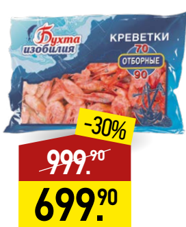
Креветки БУХТА ИЗОБИЛИЯ Отборные, неразделанные, в/м, 70/90, 850 г