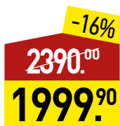
Говядина Стриплойн Black Angus, Prime, 1 кг, МИРАТОРГ *Блэк Ангус