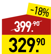
Карбонад свиной 6/к, 1 кг, МИРАТОРГ