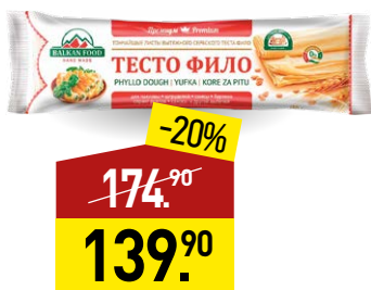
Тесто БАЛКАНФУД Фило, 450 г