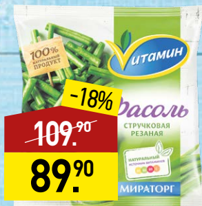
Фасоль стручковая ВИТАМИН 400 г, МИРАТОРГ