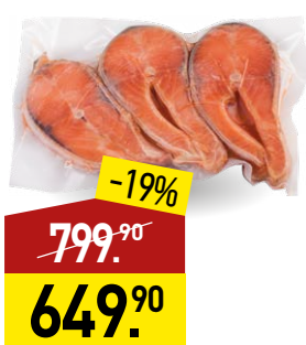
Форель ВЛАДИМИР РЫБА стейк, с/м, 500 г