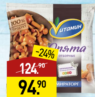
Опята ВИТАМИН 300 г, МИРАТОРГ