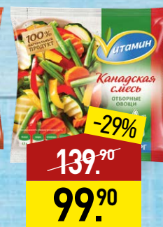
Смесь ВИТАМИН Канадская, 400 г, МИРАТОРГ