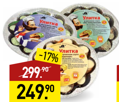
Улитки АЗОВ ТРЕЙД в ассортименте, 170 г