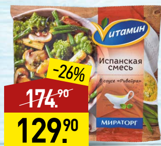
Смесь ВИТАМИН Испанская, в соусе Ривейра, 400 г, МИРАТОРГ