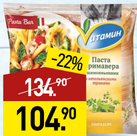
Паста ВИТАМИН Примавера, с шампиньонами и итальянскими травами, 400 г, МИРАТОРГ