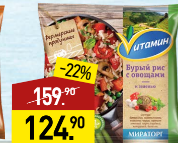
Рис бурый ВИТАМИН Фермерские продукты, с овощами и зеленью, 400 г, МИРАТОРГ