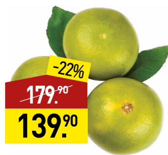
Свити 1 кг