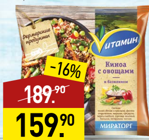
Киноа ВИТАМИН Фермерские продукты, с овощами и базиликом, 400 г, МИРАТОРГ