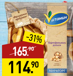
Картофельные дольки ВИТАМИН Фермерские продукты, 600 г, МИРАТОРГ