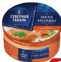
Икра мойвы СЕВЕРНАЯ ГАВАНЬ Деликатесная, с копченым лососем, 180г