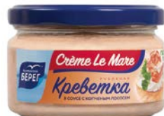
Крем ле Мар БАЛТИЙСКИЙ БЕРЕГ Кrevetки рубленые с копченым лососем, 165г