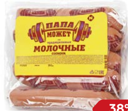
Сосиски МОЛОЧНЫЕ , Папа может, Традицион- ные (ОМПК), 600 г