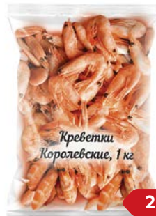
КРЕВЕТКИ КОРОЛЕВСКИЕ , с головой, варено-мороженые, 1кг