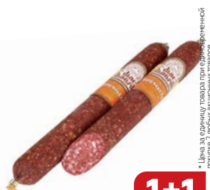
Колбаса ПРЕМЬЕРА , Дым Дымычъ, сыро- копченая, мини (Агротэк), 200 г