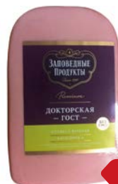
Колбаса ДОКТОРСКАЯ , вареная ГОСТ (Заповедные продукты), 400 г