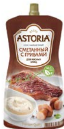
Соус майонезный АСТОРИЯ Сметанный с грибами/ Лук со сметаной, 233г