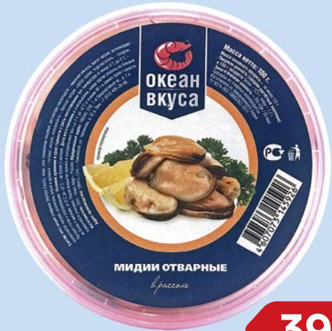
Мидии отварные ОКЕАН ВКУСА , В рассоле, 300 г