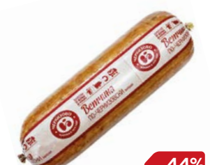
Ветчина ПО-ЧЕРКИЗОВСКИ (ЧМПЗ), 500 г