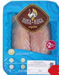
Филе индейки ПАВА ПАВА, охлажденное, грудка (Тамбовская Индейка), 600 г