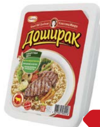
Лапша ДОШИРАК, Говядина, 90г