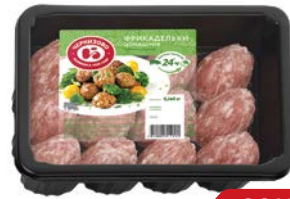
Фрикадельки ДОМАШНИЕ (ЧМПЗ), 360 г