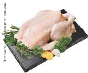
ТУШКА ЦЫПЛЕНКА- БРОЙЛЕРА, охлажденная, 1 кг