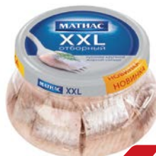
Сельдь МАТИАС , Оригинальная, филе кусочки (Санта Бремор), 260г