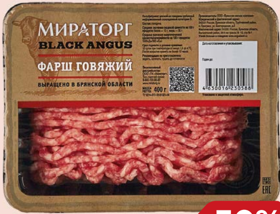
Фарш говяжий МИРАТОРГ, Охлажден- ный, 400 г