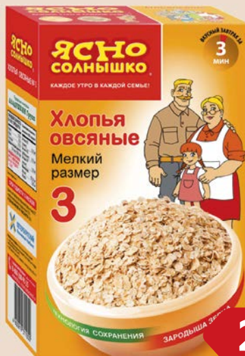
Хлопья овсяные ЯСНО СОЛНЫШКО, №3, 350г