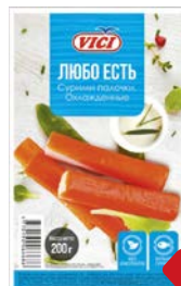
Палочки Сурими ВИЧИ , Любо есть, охлажденные, 200г