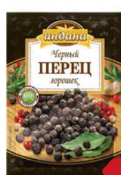
Перец ИНДАНА, Черный, горошком, 50г