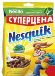
Завтрак готовый НЕСКВИК, Шарик шоколадные, 250г