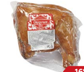
ОКОРОЧОК Цыпленка- бройлера, копчено-вареный, 100 г