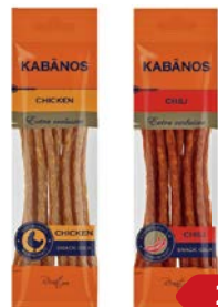
Колбаски РЕМИТ, Кабанос сыро- копченые: Чикен/ Чили, 70 г