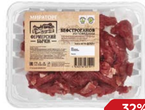
Бефстроганов МИРАТОРГ, Из говядины, охлажденный, 400 г