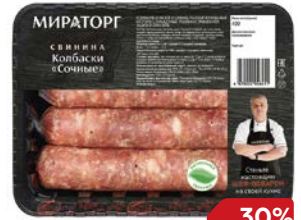
Колбаски МИРАТОРГ Сочные, 400 г