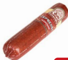
Сервелат ЦАРСКИЙ , Дым Дымычъ, варено- копченый, мини (Агротэк), 350 г