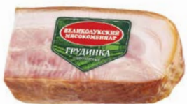
Грудинка ОХОТНИЧЬЯ, Варено-копченая (Великолукский МК), 300 г