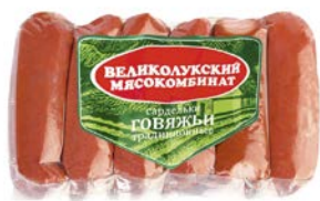
Сардельки ГОВЯЖЬИ , Традиционные, (Великолукский МК), 600 г