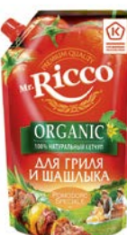
Кетчуп МИСТЕР РИККО, Помодоро Специале: Для гриля и шашлыка/ Томатный, 350г