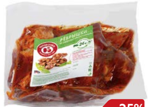
Рёбрышки ЧЕРКИЗОВО для запекания, свинные, охлажден- ные (ЧМПЗ), 1 кг