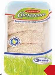
Котлеты ПЕРВАЯ СВЕЖЕСТЬ Сливочные, охлажденные (Элинар-бройлер), 600 г