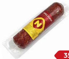
Колбаса ПРЕСИЖН , По-останкинский, сырокопченая (ОМПК), 250 г