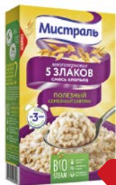
Хлопья МИСТРАЛЬ, 5 злаков, 400г