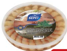
Сельдь БАЛТИЙСКИЙ БЕРЕГ , По-царски, филе кусочки в масле, с укропом, 200г