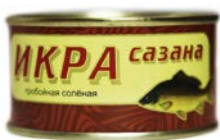
Икра сазана АВИСТРОН , Пробойная, соленая, 120г