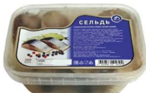
Сельдь РПЗ ПОЛЮС , кусок в пряно-солевой заливке, 300г