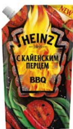
Кетчуп ХАЙНЦ, Итальянский/ Бар- бею, Кайенский/ Томатный, 350г