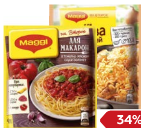
Соус МАГГИ®/ Болонез, 30г/ Плов, с курицей, 24г