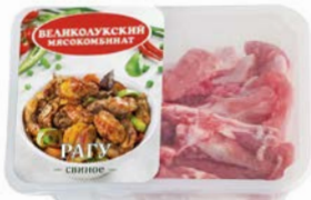
Рагу свиное ВЕЛИКОЛУКСКИЙ МЯСОКОМБИНАТ охлажденное, 400 г