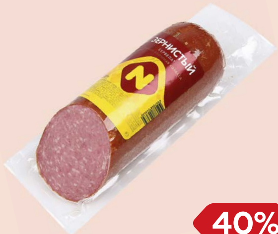
Сервелат ЗЕРНИСТЫЙ , Варено-копченый (ОМПК), 420 г