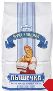
Мука ПЫШЕЧКА блинная высший сорт, 1кг