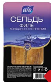
Сельдь БАЛТИЙСКИЙ БЕРЕГ , атлантическая, филе холодного копчения, 250г