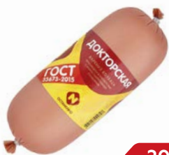
Колбаса ДОКТОРСКАЯ , вареная, мини (ОМПК), 500 г