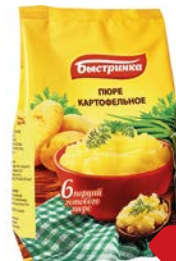
Пюре картофельное БЫСТРИНКА, 240г