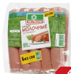
Сосиски МОЛОЧНЫЕ , мини (Велком), 600 г