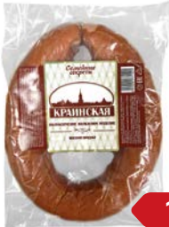
Колбаса СЕМЕЙНЫЕ СЕКРЕТЫ Краинская, полу- копченая, 500 г