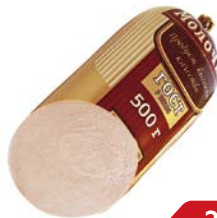
Колбаса МОЛОЧНАЯ, ГОСТ, вареная (УМКК), 500 г