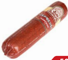
Сервелат ЦАРСКИЙ, Дым Дымычъ, варено- копченый, мини (Агротэк), 350 г