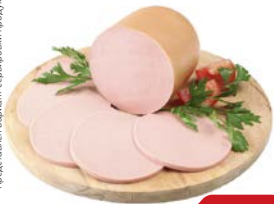
Колбаса ДОКТОРСКАЯ Оригинальная, вареная, 520 г

Представлен вариант сервелатки продукции