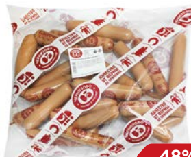
Сосиски ЧЕРКИЗОВО, сливочные (ЧМПЗ), 650 г