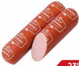
Сервелат АРИАНТ, Полукопченый (Ариант-Агро), 310 г