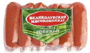
Сардельки ГОВЯЖЬИ, Традиционные, (Великолукский МК), 600 г