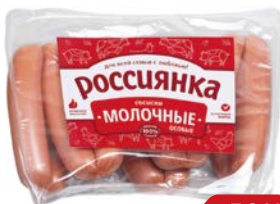
Сосиски МОЛОЧНЫЕ, Россиянка, особые (Агротэк), 500 г