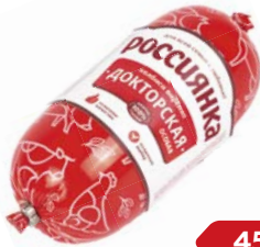
Колбаса ДОКТОРСКАЯ Россиянка Особая вареная (Агротэк), 450 г