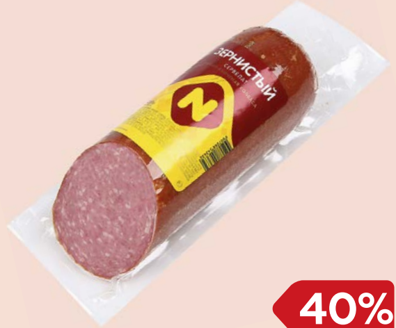
Сервелат ЗЕРНИСТЫЙ, Варено-копченый (ОМПК), 420 г