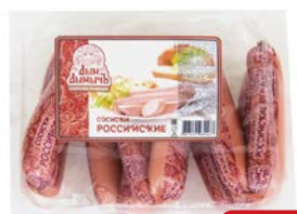
Сосиски РОССИЙСКИЕ, Дым Дымычъ (Агротэк), 500 г