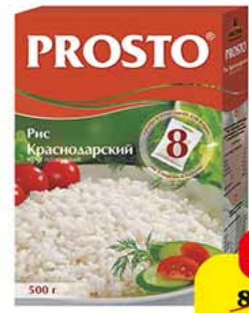
РИС КРУГЛОЗЕРНЫЙ КРАСНОДАРСКИЙ PROSTO 8*62,5 Г