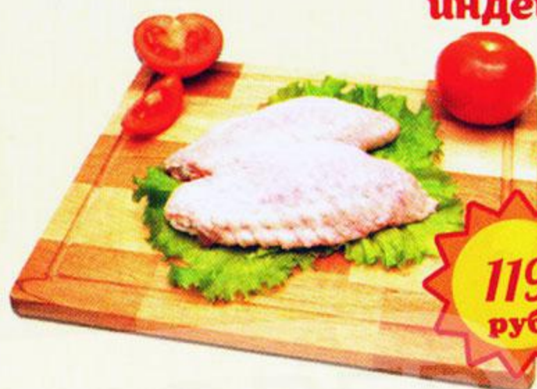
Крыло локоть индейки