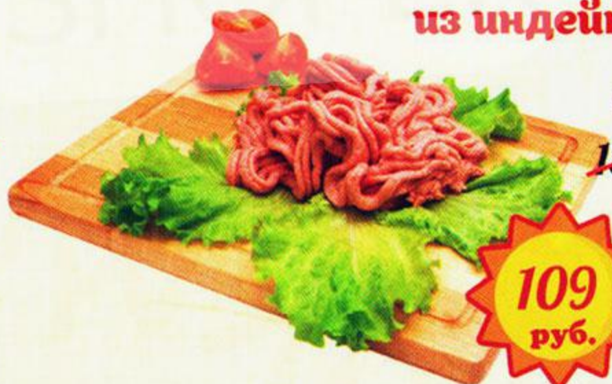
Фарш из индейки