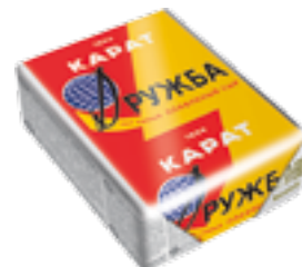
ПЛАВЛЕННЫЙ СЫР ДРУЖБА КАРАТ 90 Г