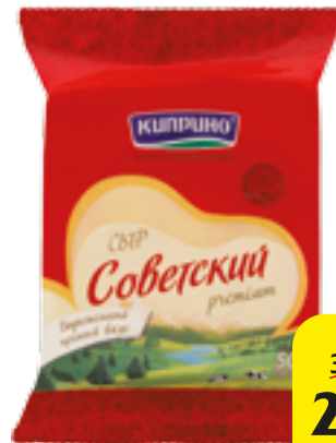
СЫР СОВЕТСКИЙ КИПРИНО 300 Г