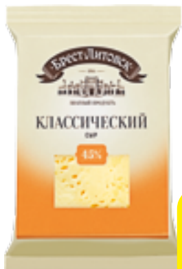
СЫР КЛАССИЧЕСКИЙ БРЕСТ-ЛИТОВСК 200 Г