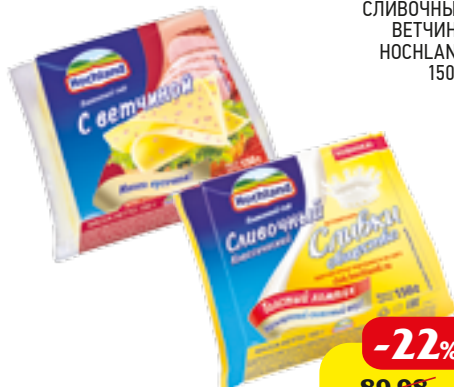
ПЛАВЛЕННЫЙ СЫР СЛИВОЧНЫЙ ВЕТЧИНА НОСЧЛАНД 150 Г