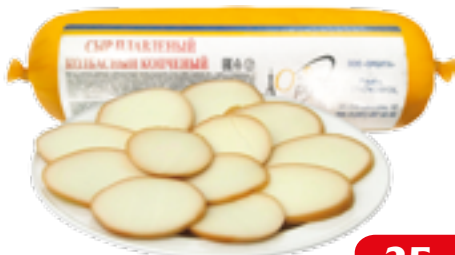
ПЛАВЛЕННЫЙ СЫР КОЛБАСНЫЙ ОРБИТА 100 Г