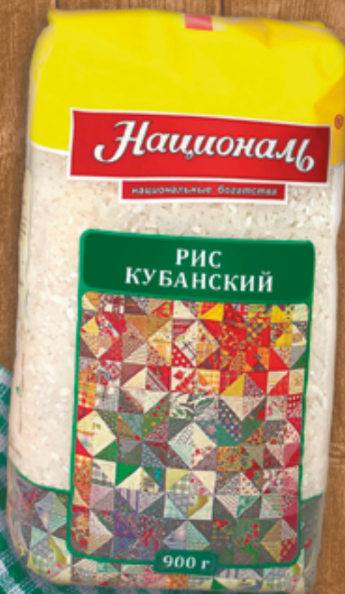
РИС КРУГЛОЗЁРНЫЙ КУБАНСКИЙ НАЦИОНАЛЬ 900 Г