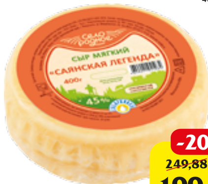
СЫР САЯНСКАЯ ЛЕГЕНДА СЕЛО РОДНОЕ 400 Г