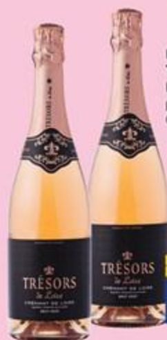
ВИНО ИГРИСТОЕ TRÉSORS CRÉMANT DE LOIRE, выдержанное, розовое брют, 0,75 л, Франция