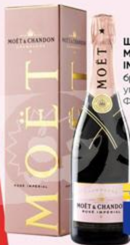
ШАМПАНСКОЕ MOËT & CHANDON IMPERIAL, розовое брют, в подарочной упаковке, 0,75 л, Франция