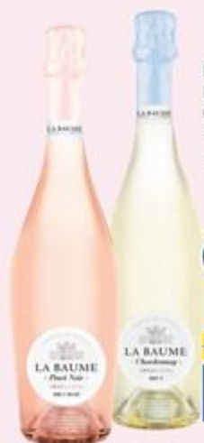
ВИНО ИГРИСТОЕ LA BAUME, брют, 0,75 л, Франция: - Пино Нуар, розовое - Шардоне, белое