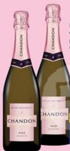
ВИНО ИГРИСТОЕ CHANDON ROSE, розовое брют, 0,75 л, Аргентина