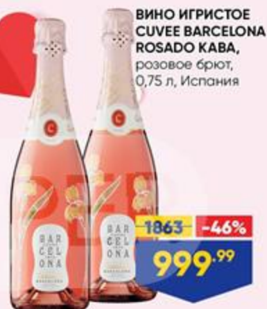
ВИНО ИГРИСТОЕ CUVÉE BARCELONA ROSADO KABA, розовое брют, 0,75 л, Испания

Каждый день особенный, если рядом с Вами самые родные и близкие люди. Дарите им свою любовь и пусть День всех влюбленных будет полон счастливыми мгновениями, а об остальном позаботится «ЛЕНТА»