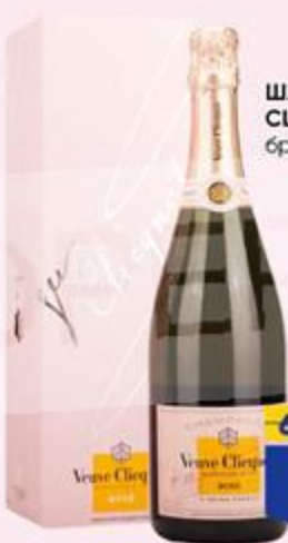
ШАМПАНСКОЕ VEUVE CLICQUOT, розовое брют, 0,75 л, Франция