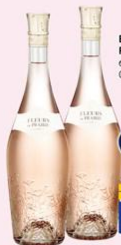
ВИНО ИГРИСТОЕ FLEURS DE PRAIRIE, белое/розовое, брют, 0,75 л, Франция