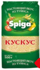
Кускус СПИГА, 500 г