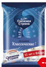
Пельмени СНЕЖНАЯ СТРАНА, классические, 430 г