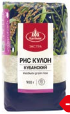
Рис КУЛОН, Кубанский (Агро- Альянс), 900 г