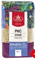
Рис ЭКСТРА, Бурый, Слим и Фит (Агро-Альянс), 800 г