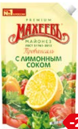
Майонез МАХЕЕВ, Провансаль, с лимонным соком, 770 г