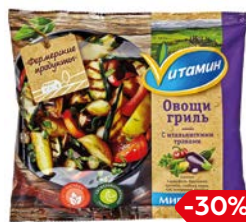
Овощи-гриль ВИТАМИН замороженные (Мираторг), 400 г