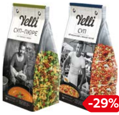
Суп ЙЕЛЛИ, Чечевичный/ Бобовый, 250 г