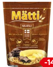
Мюсли МАТТИ, Банан и шоколад, 250 г