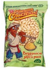
Рис воздушный ПРАЗДНИК СЛАСТЕН, в карамели, 60 г