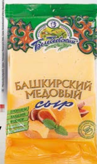
Сыр БАШКИРСКИЙ Белебеевский 50%, 220 г