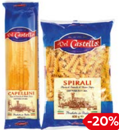
Макаронные изделия ДЕЛЬ КАСТЕЛЛО, в ассортименте***, 400 г