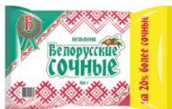
Пельмени БЕЛОРУССКИЕ Сочные (Петрохо- лод), 900 г