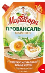
Майонез МИЛАДОРА, Провансаль, 50%, 750 г