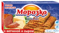
Блины МОРОЗКО , С ветчиной и сыром, 420 г