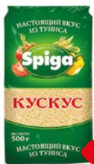
Кускус СПИГА, 500 г