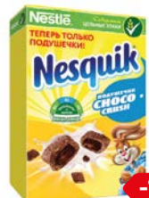
Подушечки шоко- ладные, 220 г