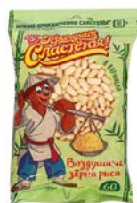
Рис воздушный ПРАЗДНИК СЛАСТЕН , в карамели, 60г