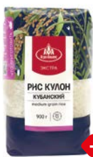
Рис КУЛОН, Кубанский (Агро- Альянс), 900 г