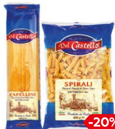
Макаронные изделия ДЕЛЬ КАСТЕЛЛО, в ассортименте***, 400 г