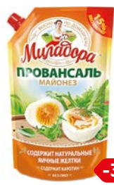
Майонез МИЛАДОРА, Провансаль, 50%, 750 г