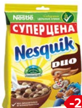
Завтрак готовый НЕСКВИК, Дуо Шарики молочные и шоколадные, 250 г