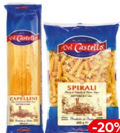
Макаронные изделия ДЕЛЬ КАСТЕЛЛО, в ассортименте***, 400 г