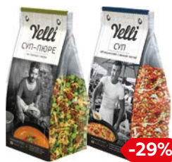
Суп ЙЕЛЛИ, Чечевичный/ Бобовый, 250 г