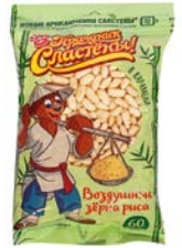
Рис воздушный ПРАЗДНИК СЛАСТЕНЫ, в карамели, 60 г