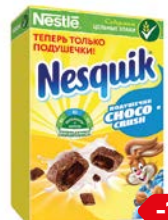
Подушечки шоко- ладные, 220 г