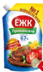
Майонез ЕЖК Провансаль 67%, 675 г