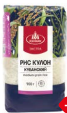
Рис КУЛОН, Кубанский (Агро- Альянс), 900 г