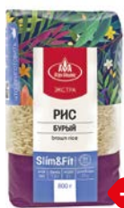
Рис ЭКСТРА, Бурый, Слим и Фит (Агро-Альянс), 800 г