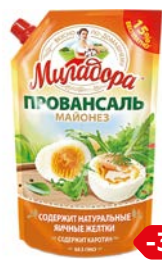
Майонез МИЛАДОРА, Провансаль, 50%, 750 г