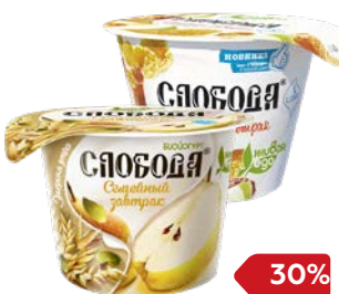
Йогурт СЛОБОДА, Мюсли-яблоко- мандарин-орех/ Груша-лаки- семена льна, 210 г