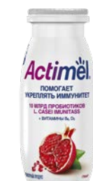
Напиток кисломолочный АКТИМЕЛЬ в ассортименте***, 100 г