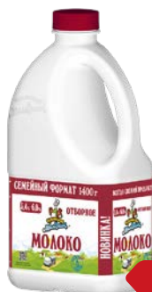
Молоко КУБАНСКИЙ МОЛОЧНИК, Отборное 3,4-6%, 1400 г