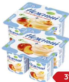
Продукт йогуртный НЕЖНЫЙ, С соком: Абрикоса и манго/ Клубники/ Персика, 100 г