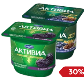
Биойогурт АКТИВИА, в ассортименте***, 150 г