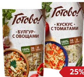
ГОТОВО! , Плов с грибами/ Булгур с овощами/ Кускус с томатами, 250 г