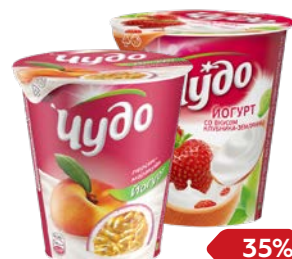
Йогурт ЧУДО, Клубника-земляника/ Персик-маракуйя/ Вишня-черешня, 290 г