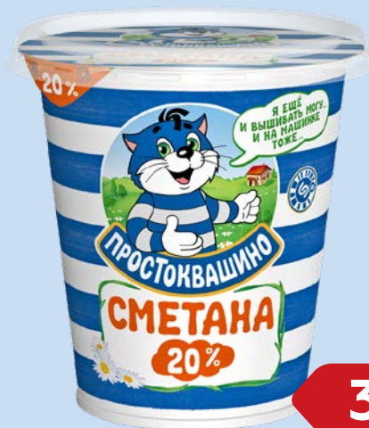
Сметана ПРОСТОКВАШИНО, 20%, 315 г