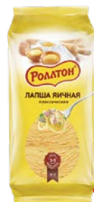
Лапша РОЛЛТОН , Яичная, Класси- ческая, 400 г