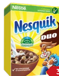
Завтрак готовый НЕСКВИК , Дуо, 375 г