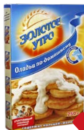
Оладьи ЗОЛОТОЕ УТРО , по-домашнему, 250 г