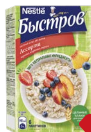
Каша овсяная БЫСТРОВ , Ассорти: Черника, клубника, персик, 6 пакетиков x 40 г