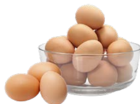
ЯЙЦО СТОЛОВОЕ, С-1, 10 шт.