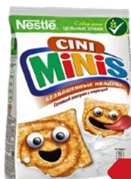
Завтрак готовый СИНИ МИНИС , Безбашенные квадры с корицей, 250 г