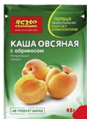
Каша овсяная ЯШО СОЛНЫШКО , абрикос, 45 г