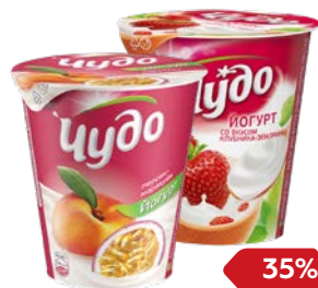
Йогурт ЧУДО, Клубника-земляника/ Персик-маракуя/ Вишня-черешня, 290 г