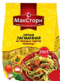
Лапша МАКСТОРИ , Лагманная, высший сорт, 200 г