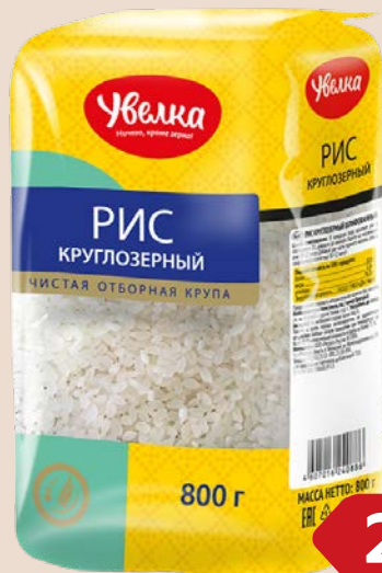
Рис круглозерный УВЕЛКА , Красно- дарский, 800 г