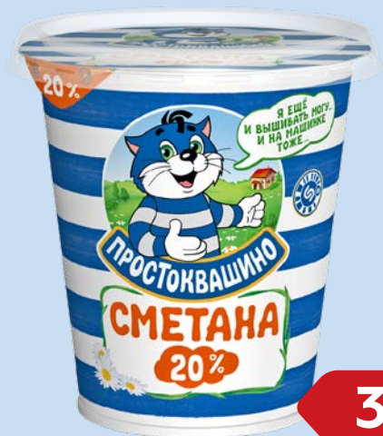
Сметана ПРОСТОКВАШИНО, 20%, 315 г