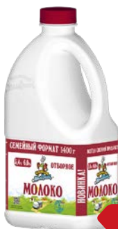
Молоко КУБАНСКИЙ МОЛОЧНИК, Отборное 3,4–6%, 1400 г