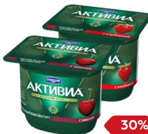
Биоийогурт АКТИВИЯ, В ассортименте***, 150 г