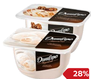
Продукт творож- ный ДАНИССИМО, В ассортименте***, 130 г