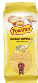
Лапша РОЛЛТОН , Яичная, Класси- ческая, 400 г