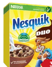
Завтрак готовый НЕСКВИК , Дуо, 375 г