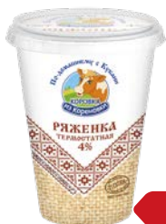
Ряженка КОРОВКА ИЗ КОРЕНОВКИ, 4%, термостатная, 350 г