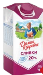
Сливки ДОМИК В ДЕРЕВНЕ 20%, 480 г