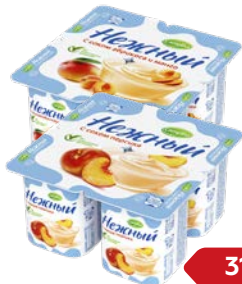
Продукт йогуртный НЕЖНЫЙ, С соком: Абрикоса и манго/ Клубники/ Персика, 100 г