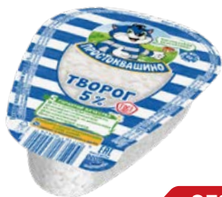
Творог ПРОСТОКВАШИНО, 5%, 220 г