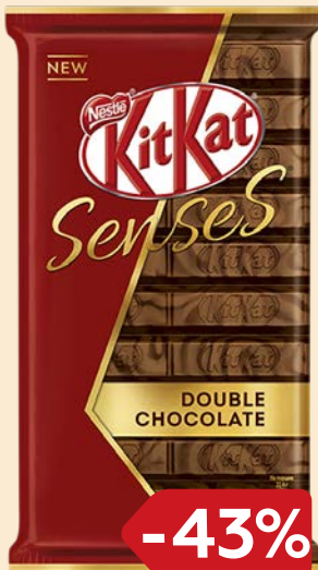
Шоколад КИТ КАТ Сенсез, В ассортименте***, 112 г