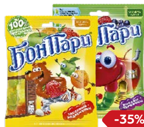
Мармелад жевательный БОН ПАРИ, В ассортименте***, 75 г