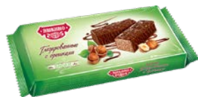
Вафли ЯШКИНО , с орешками глазированные, 200 г