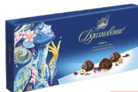
Конфеты ВДОХНОВЕНИЕ, Шоколадное пралине, с дробленым фундуком, 400 г