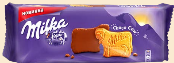
Печенье МИЛКА , Чоко Коу, 200 г