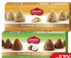
Конфеты РОДНЫЕ ПРОСТОРЫ, Фундук/ С вафельной крошкой, 125 г