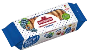
Печенье ПОСИДЕЛКИНО , Овсяное, с изю- мом, 310 г