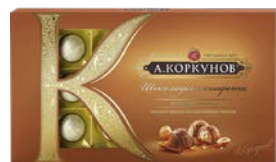
Конфеты КОРКУОВ, молочный шоколад, 192 г