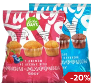
Мини-маффинсы LUCKY DAYS ® С дже- мом: Лесные ягоды/ Клубничный; С какао, молочная начинка, 500 г