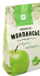
Монпансье МИНИ-М В ассортименте***, 50 г