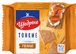
Хлебцы ЩЕДРЫЕ , Тонкие ржаные, 170 г