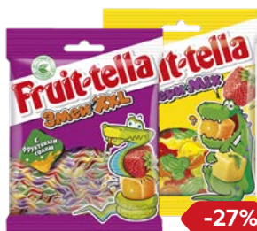
Жевательный мармелад ФРУТТЕЛЛА, Звери, микс/ Медвежата/ Змеи, 70 г