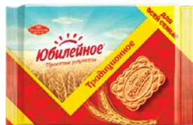
Печенье ЮБИЛЕЙНОЕ , тра- диционное, 313 г