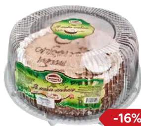
Торт Я ТЕБЯ ЛЮБЛЮ , (Золотой колос), 800 г