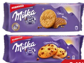
Печенье МИЛКА , Чоко Куки/ Чоко Грейп, с овсяными хлопьями в молоч- ной шоколад, 168 г