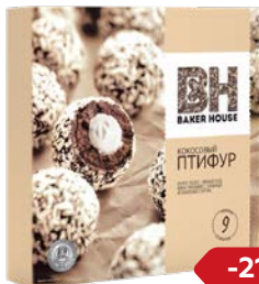
Пирожное ПТИФУР кокосо- вый крем, 225 г