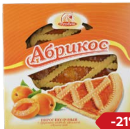
Пирог песочный ФРУТКЕЙК , С абрикосовой начинкой, 430 г