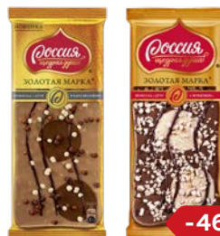
Шоколад ЗОЛОТАЯ МАРКА, Дуэт: В карамельном/ С фундуком/ С миндалем, 85 г