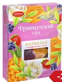
Мармелад ФРАНЦУЗСКИЙ САД (Азовская КФ), 300 г