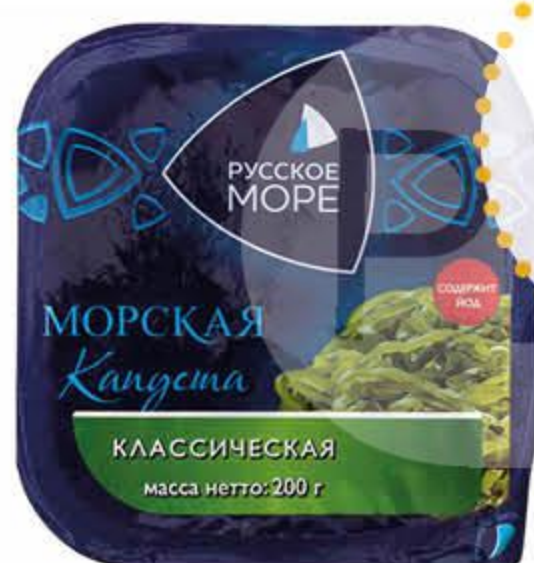
Салат из морской капусты РУССКОЕ МОРЕ Классический