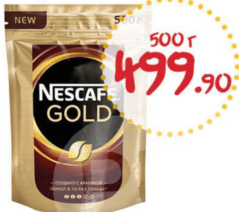
Кофе НЕСКАФЕ Голд растворимый