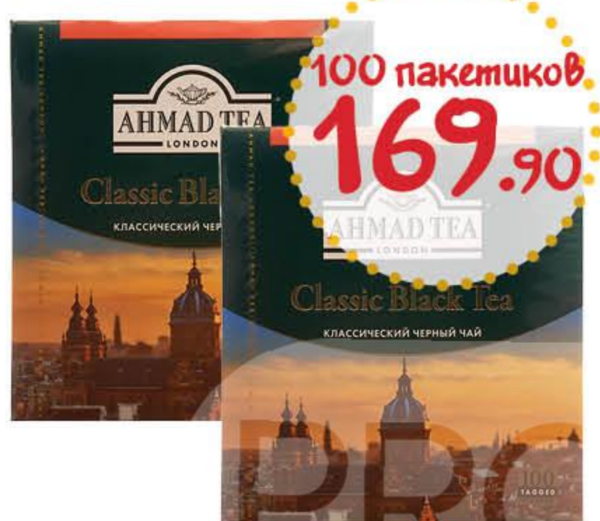
Чай АХМАД Классический черный