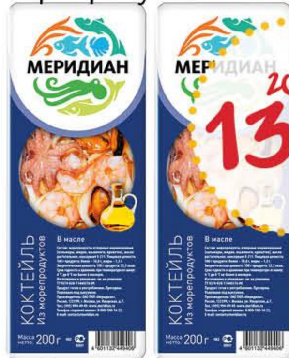
Коктейль МЕРИДИАН из морепродуктов в масле