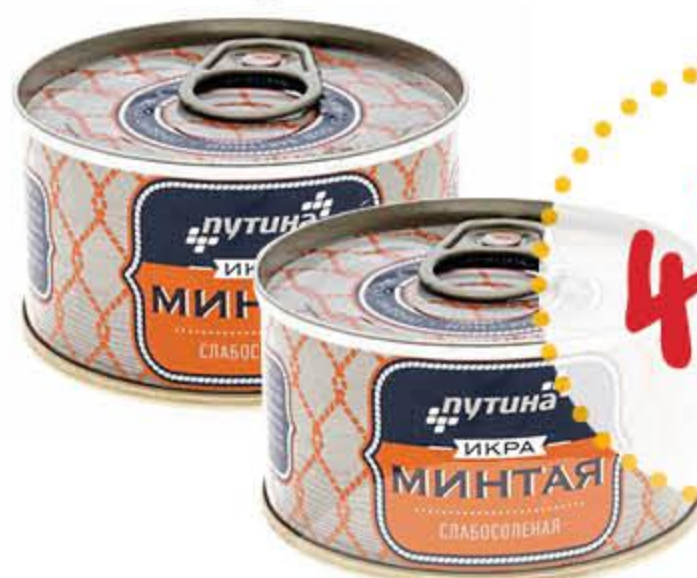
Икра минтая ПУТИНА соленая пробойная