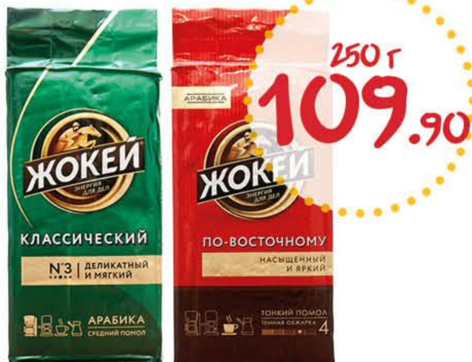
Кофе ЖОКЕЙ по-восточному, классический молотый