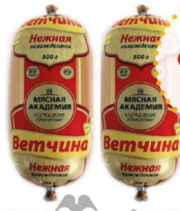
Ветчина МЯСНАЯ АКАДЕМИЯ Нежная