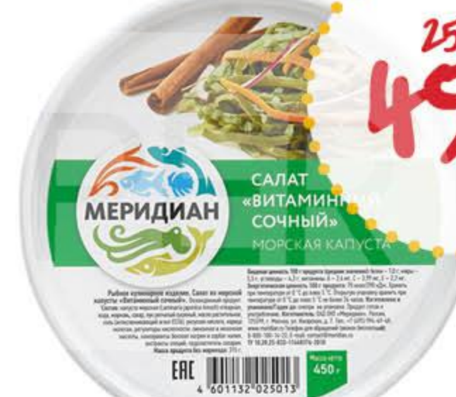
Салат из морской капусты МЕРИДИАН Витаминный