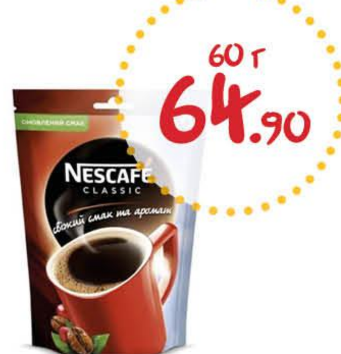
Кофе НЕСКАФЕ Классик