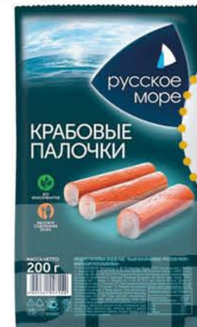
Крабовые палочки РУССКОЕ МОРЕ охлажденные