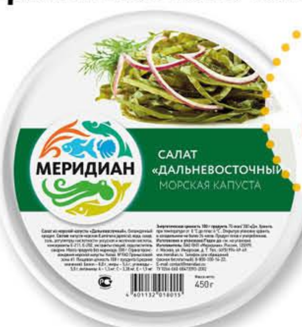
Салат из морской капусты МЕРИДИАН Дальневосточный