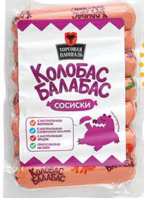
Сосиски ТОРГОВАЯ ПЛОЩАДЬ Колобас-Балабас мини