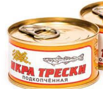
Икра трески НЕВОД