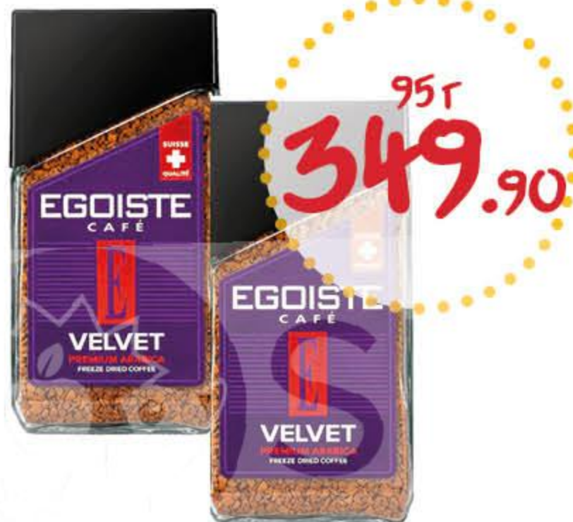
Кофе ЭГОИСТ Вельвет