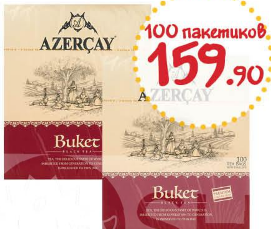
Чай АЗЕРЧАЙ Премиум Букет черный