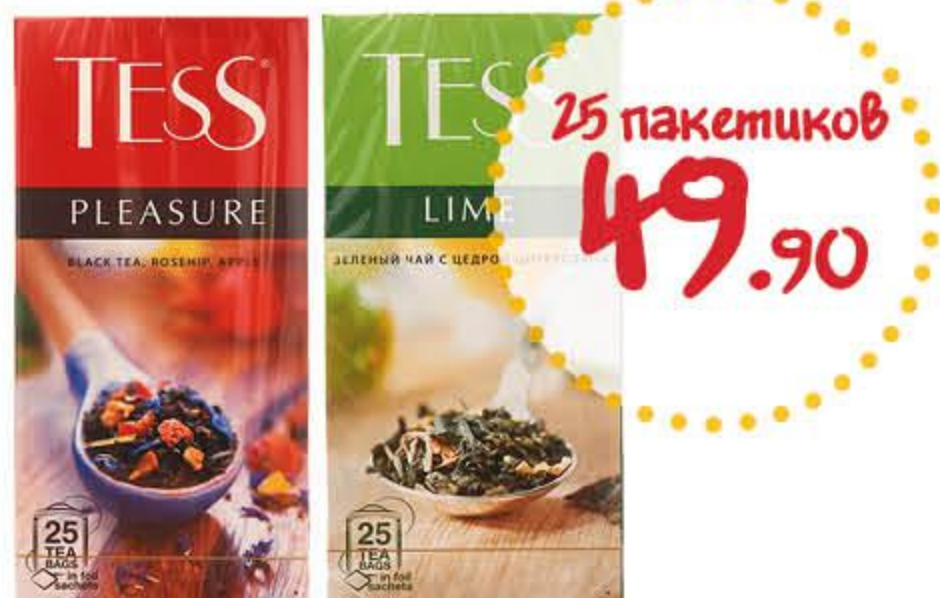
Чай ТЕСС Плежэ черный, Лайм зеленый