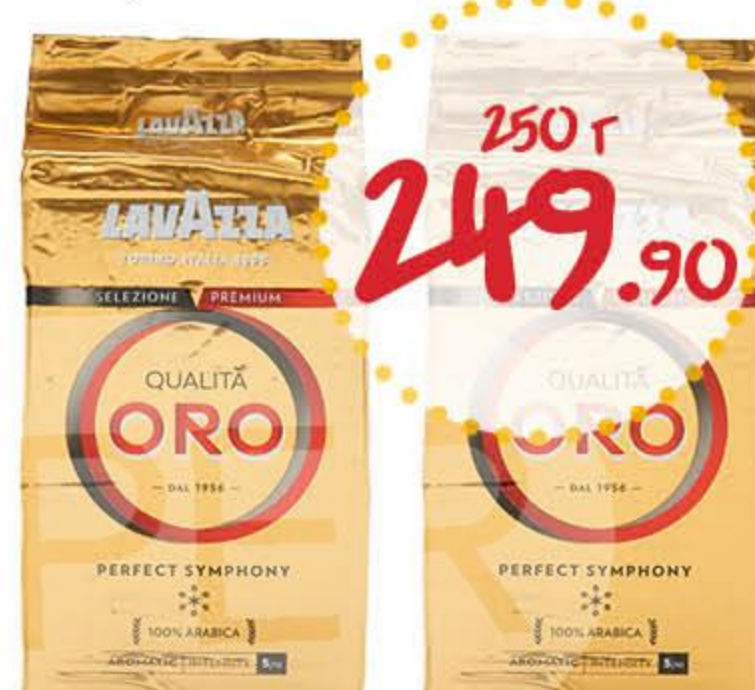
Кофе ЛАВАЦЦА Оро зерно, молотый