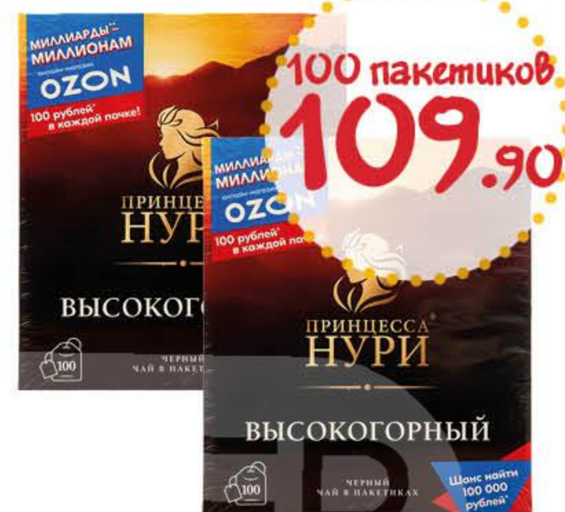
Чай НУРИ Высокогорный с ярлыком