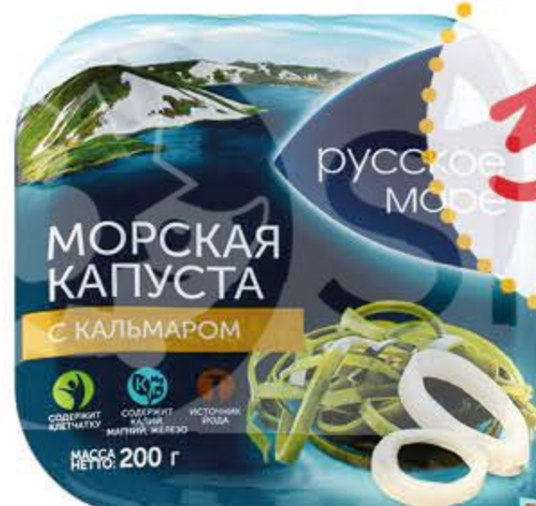
Салат из морской капусты РУССКОЕ МОРЕ с кальмаром