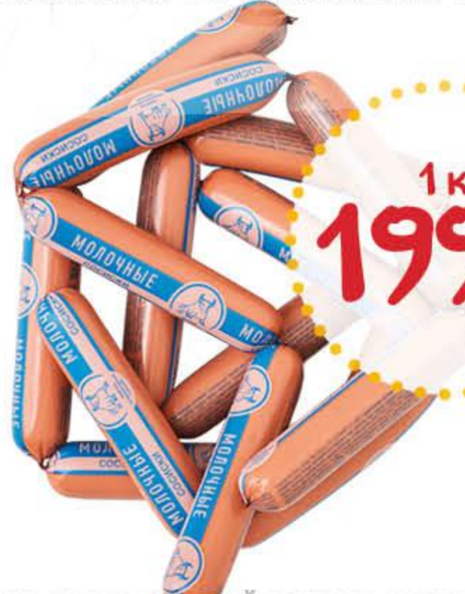
Сосиски СПК Молочные