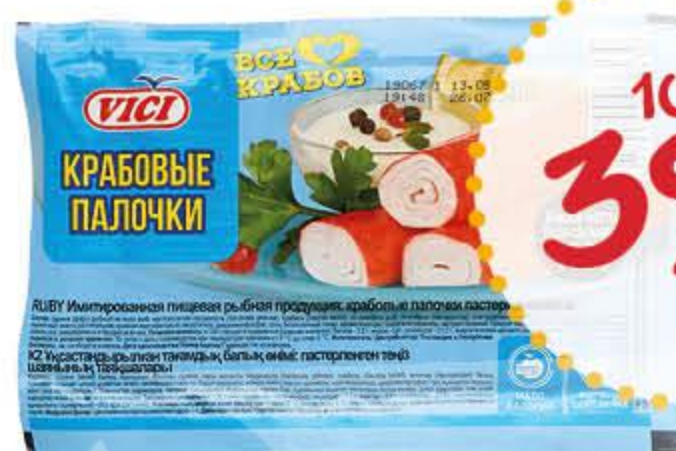
Крабовые палочки ВИЧИ охлажденные