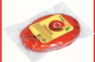
КОЛБАСА "КРИКОВСКАЯ" ИНЕЙ, П/К, 300 ГР Продажа только на Косыгина, 21