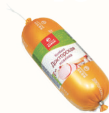
КОЛБАСА "ДОКТОРСКАЯ" НОВИНКА ВАР., ВНМД, 400 ГР Продажа только на Косыгина, 21