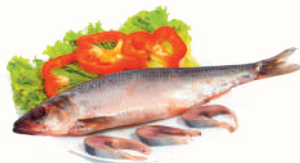
СЕЛЬДЬ С/С, 1 КГ