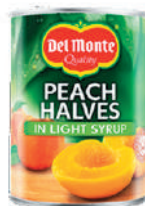
ПЕРСИКИ В СИРОПЕ "ДЕЛЬ МОНТЕ", 420 ГР