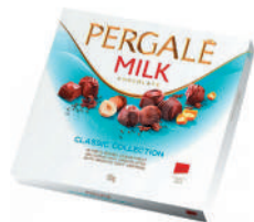
НАБОР КОНФЕТ "ПЕРГАЛЕ МИЛК", 125 ГР