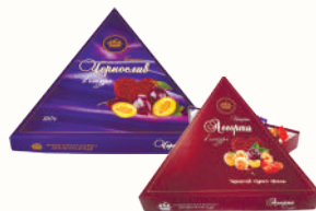
КОНФЕТЫ "ЧЕРНОСЛИВ В ГЛАЗУРИ", "АССОРТИ В ГЛАЗУРИ" 160 ГР