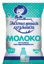
МОЛОКО ПИТЬЕВОЕ 1,5%, 900 МЛ