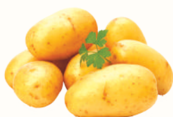
КАРТОФЕЛЬ КРУПНЫЙ, 1 КГ