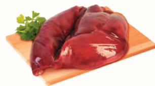
ПЕЧЕНЬ СВИНАЯ С/М, 1 КГ