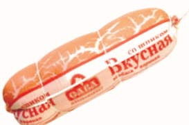
КОЛБАСА "ВКУСНАЯ СО ШПИКОМ" ВАР., САВА, 1 КГ