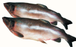
ГОРБУША ДАЛЬНЕВОСТОЧНАЯ ПСГ С/М, 1 КГ