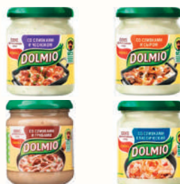
СОУС "ДОЛМИО" В АССОРТИМЕНТЕ, 200 ГР