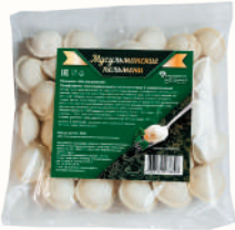
ПЕЛЬМЕНИ "МУСУЛЬМАНСКИЕ" , 350 ГР