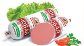
КОЛБАСА "НОВАЯ" САВА, ВАР., 1 КГ