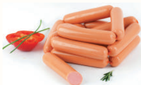
СОСИСКИ "КУРИНЫЕ" ОХЛ., АНКОМ, 1 КГ