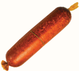
КОЛБАСА "ЗАКУСОЧНАЯ" В/К, ЕВРОКОМ, 1 КГ