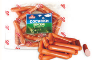
СОСИСКИ "ВЕНСКИЕ" ОХЛ., САВА, 1 КГ Продажа только на Косыгина, 21