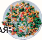
СМЕСЬ "ГАВАЙСКАЯ" С/М, 1 КГ