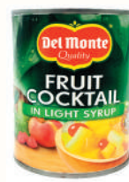
КОКТЕЙЛЬ ФРУКТОВЫЙ "ДЕЛЬ МОНТЕ", 420 ГР