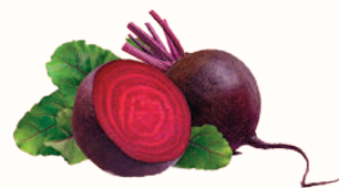
СВЕКЛА, 1 КГ

Ждём Вас с 08:00 до 02:00 по адресам: Санкт-Петербург, м. "Ладожская", пр. Косыгина, 21, м. "Пр. Просвещения", ул. Хошимина, 14