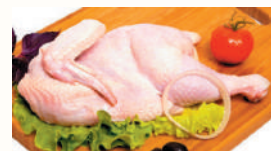
ЦЫПЛЕНОК ОХЛАЖДЕННЫЙ, (ПОЛУТУШКА), 1 КГ