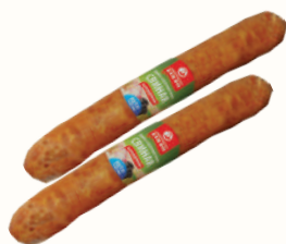
КОЛБАСА "СВИНАЯ" П/К, ВНМД, 240 ГР