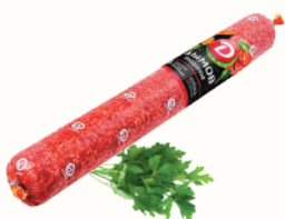
КОЛБАСА "ПРАЗДНИЧНАЯ" С/К, ДЫМОВ. 1 КГ