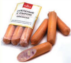
СОСИСКИ "РУБЛЕННЫЕ С СЫРОМ" ОХЛ., САВА, 420 ГР Продажа только на Косыгина, 21