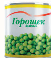
ГОРОШЕК ЗЕЛЕНЫЙ, 400 ГР