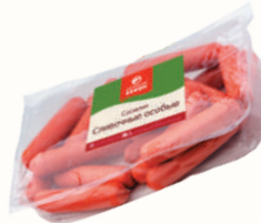
СОСИСКИ "СЛИВОЧНЫЕ" ОСОБЫЕ ОХЛ., ВНМД, 1 КГ