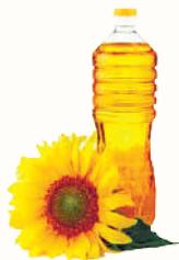
МАСЛО ПОДСОЛНЕЧНОЕ РАФ., ДЕЗ., 0,8 Л