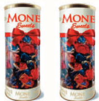
НАБОР КОНФЕТ "МОНЕ", 350 ГР