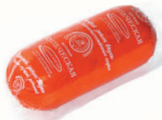
ВЕТЧИНА "КУПЕЧЕСКАЯ" ОХЛ., ИНЕЙ, 400 ГР