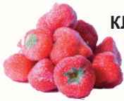
КЛУБНИКА С/М, 1 КГ