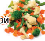
СМЕСЬ "ОВОЩНОЙ БУКЕТ" С/М, 1 КГ