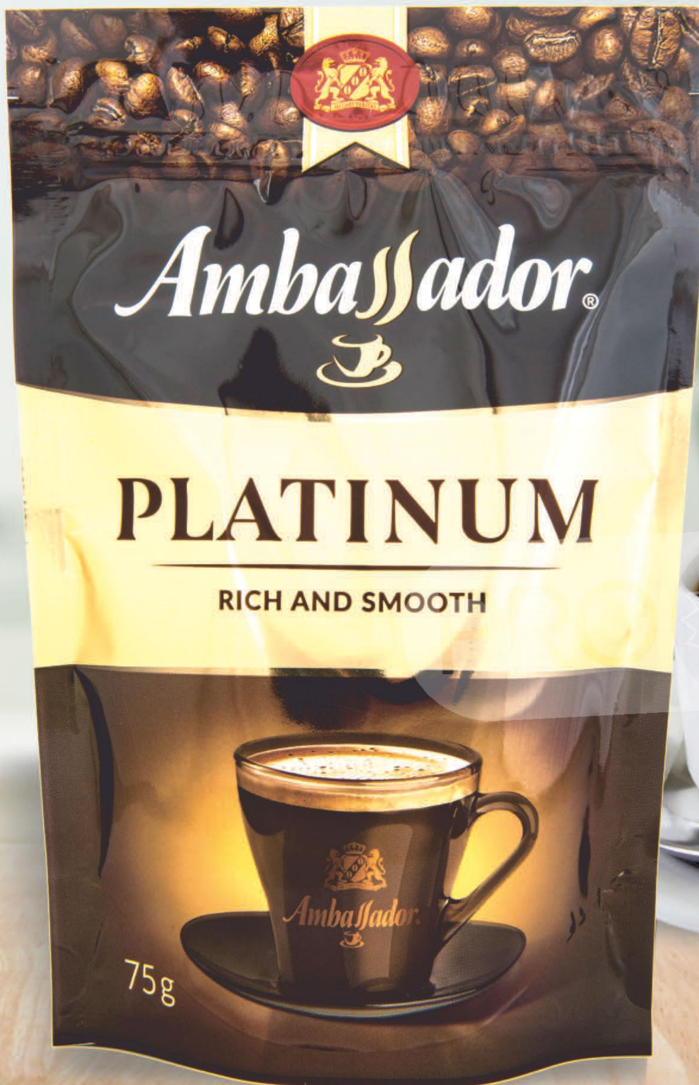
КОФЕ АМБАССАДОР, платинум, растворимый, 75 г