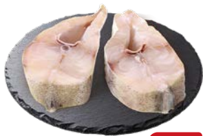
СТЕЙК ТРЕСКОВЫХ ПОРОД Минтай, 800 г