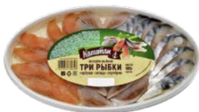
Рыбное ассорти КАПИТАН горбуша- скумбрия-сельдь (ИП Лукашов), 180 г