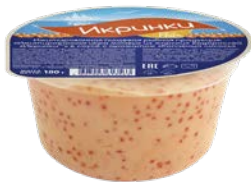
ИКРА МОЙВЫ имитированная в соусе с ароматом копченого лосося, 180 г