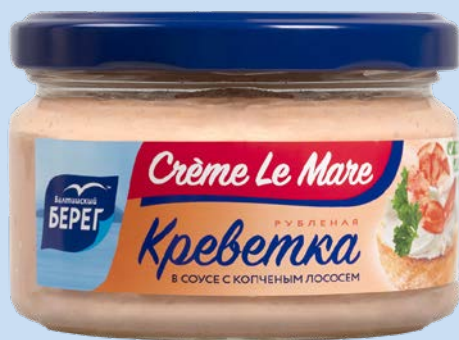
Креме ля Маре БАЛТИЙСКИЙ БЕРЕГ Креветка рубленая в соусе с копченым лососем, 165 г