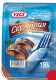
Скумбрия ВИЧИ, Филе кусочки в масле, холодного копчения, 150 г