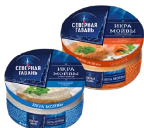
Икра мойвы СЕВЕРНАЯ ГАВАНЬ, Класси- ческая / С копченым лососем, 180 г