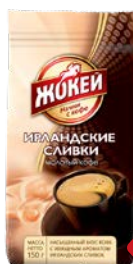
Кофе ЖОКЕЙ , Молотый, с аро- матом ирландских сливок, 150 г