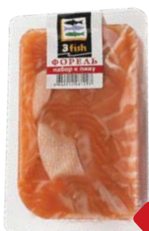
Форель 3 ФИШ ливной набор слабосоленный, 130 г