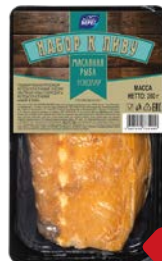
Эсколар БАЛТИЙСКИЙ БЕРЕГ, холодного копчения, набор к пиву, 200 г