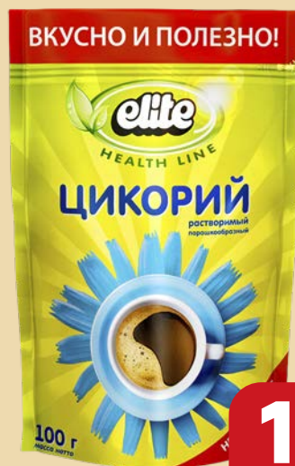
Цикорий ЭЛИТ, Хелс лайн, раство- римый, 100 г