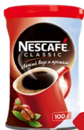
Кофе НЕСКАФЕ , Классик, Раствори- мый, 100 г

* Цена за единицу товара при одновременной покупке 2 одинаковых акционных товаров