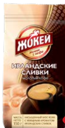
Кофе ЖОКЕЙ , Молотый, с аро- матом ирландских сливок, 150 г