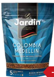
Кофе ЖАРДИН , Колумбия Медел- лин, сублимиро- ванный, 150 г