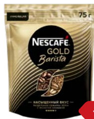
Кофе НЕСКАФЕ , Голд Бариста, Молотый в раство- римом, 75 г