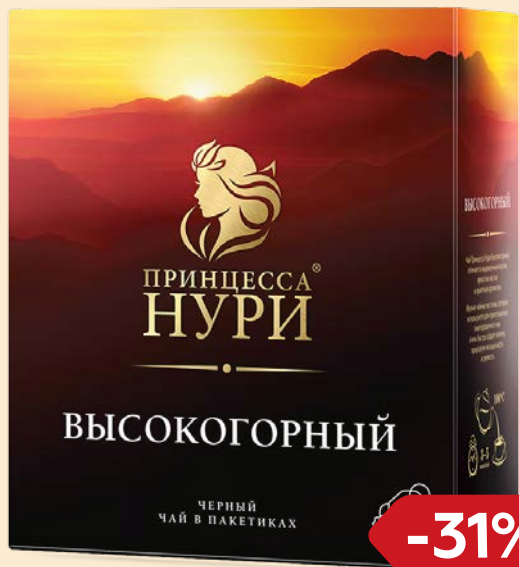
Чай черный ПРИНЦЕССА НУРИ , Высокогорный, 100 пакетиков