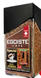
Кофе ЭГОИСТ , Спешл, сублими- рованный, 100 г