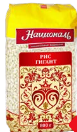
Рис НАЦИОНАЛЬ , Гигант, 800 г