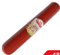
Салами ФИНСКАЯ , Варено-копченая, с можжевельником (Тавр), 100 г