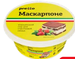
Сыр ПРЕТТО, Маскарпоне, мягкий, 250 г