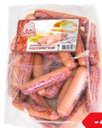
Сосиски РОССИЙСКИЕ , Дым Дымычъ (Агротэк), 100 г