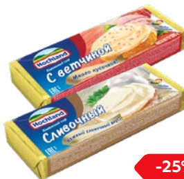
Сыр плавленый ХОХЛАНД, Сливоч- ный/Ветчина, 100 г