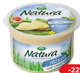
Сыр сливочный АРЛА НАТУРА, Лайт, 400 г