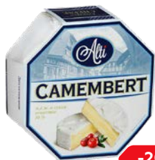
Сыр АЛТИ Камамбер с белой плесенью, 125 г