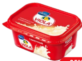
Сыр плавленый ВИОЛА сливоч- ный, 400 г