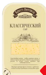
Сыр БРЕСТ-ЛИТОВСК, Классический, 45%, нарезка, 150 г