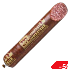
Сервелат МУСКАТНЫЙ , Есть, полукоп- ченый (Динской МПК), 100 г