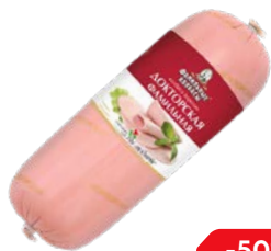
Колбаса ДОКТОРСКАЯ , Фамильная (Фамильные колбасы), 100 г