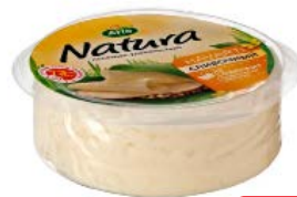
Сыр АРЛА НАТУРА сливочный 45%, 200 г