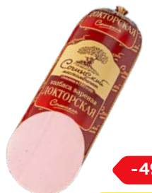
Колбаса ДОКТОРСКАЯ Вареная (Сочин- ский МК), 100 г