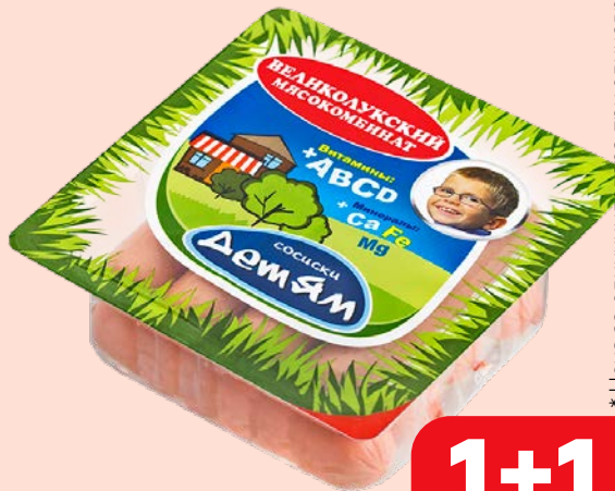
Сосиски ДЕТЯМ (Великолукский МК), 330 г