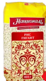
Рис НАЦИОНАЛЬ , Гигант, 800 г