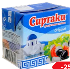
Сыр фета СИРТАКИ, Для греческого салата, 500 г