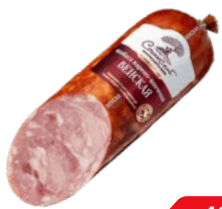
Колбаса ВЕНСКАЯ , Варено-копченая (Сочинский МК), 400 г