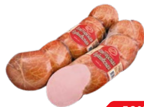
Колбаса ДОКТОРСКАЯ , Дубковская (МК Дубки), 100 г