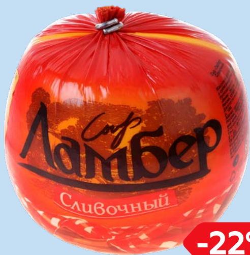
Сыр ЛАМБЕР, Сливочный, 100 г