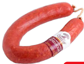
Колбаса ВАРШАВСКАЯ , Полукопченая (Сочинский МК) 100 г