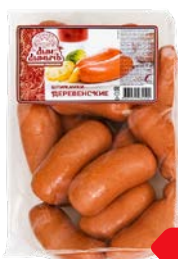
Шпикачки ДЕРЕВЕНСКИЕ , Дым Дымычъ (Агротэк), 100 г