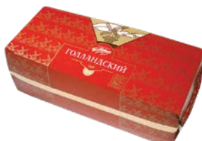
Сыр ГОЛЛАНДСКИЙ, (Белебеевский МК), 100 г