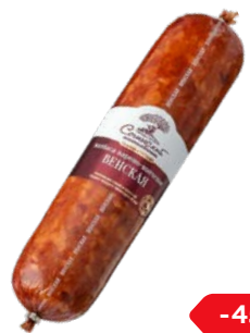
Колбаса ВЕНСКАЯ Варено-копченая (Сочинский МК), 100 г

* Цена за единицу товара при одновременной покупке 2 одинаковых акционных товаров