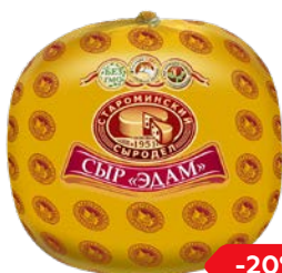
Сыр ЭДАМ, 45% (Староминский Сыродел), 100 г