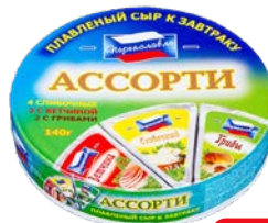
Сыр плавленый ПЕРЕЯСЛАВЛЬ, Ассорти, 140 г