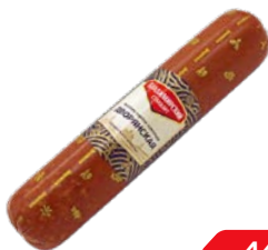
Колбаса ДВОРЯНСКАЯ , варено-копченая (Владимирский Стандарт), 100 г