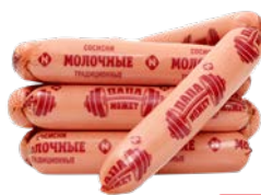
Сосиски ТРАДИЦИОННЫЕ , Молочные традици- онные (ОМПК), 100 г