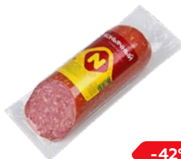
Сервелат КОНЬЯЧНЫЙ , варено-копченый (ОМПК), 100 г