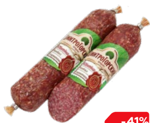
Колбаса ЮБИЛЕЙНАЯ , сырокопченая (Дмитрогорский МПЗ), 250 г