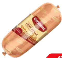
Колбаса ДОКТОРСКАЯ , По-стародворски (Стародворская Колбаса), 500 г