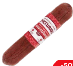
Колбаса ЮБИЛЕЙНАЯ , Россиянка, сырокопченая (Агротэк), 200 г