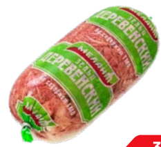
Зельц МЕЛАНТ , Деревенский охлажденный, вареный свиной, 500 г