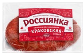
Колбаса КРАКОВСКАЯ Россиянка, Особая, полукопченая мини (Агротэк), 100 г

* Цена за единицу товара при одновременной покупке 2 одинаковых акционных товаров