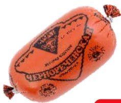
Ветчина ЧЕРНОРЕЧЕНСКАЯ (Дзержинский МК), 400 г