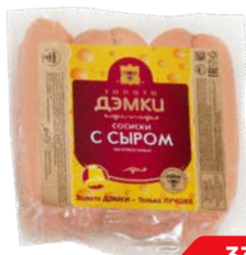
Сосиски С СЫРОМ Золото Дэмки (Дзержинский), 450 г