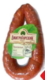
Колбаса КРАКОВСКАЯ , полукопченая, мини (Дмитро- горский продукт), 400 г