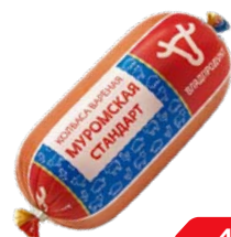
Колбаса МУРОМСКАЯ , Стандарт, вареная (Владимирский стандарт), 500 г