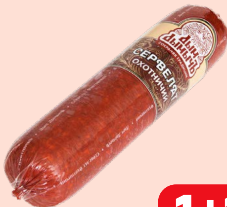
Сервелат ОХОТНИЧИЙ Дым Дымычъ, варено-копченый, мини (Агротэк), 350 г