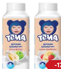
БиоЙогурт питьевой** ТЕМА , В ассортименте***, 210 г