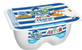
Творог ПРОСТОКВАШИНО , для детей, без сахара, 100 г