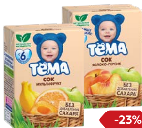
Сок** ТЕМА , в ассортименте***, 200 мл