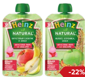
Пюре** ХАЙНЦ , В ассортименте***: 90 г/ 100 г