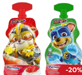
Йогурт РАСТИШКА , Клубника/Яблоко- груша, 70 г