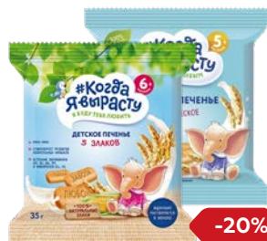
Печенье** КОГДА Я ВЫРАСТУ Классическое/ 5 злаков, 35 г