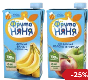
Соки и нектары** ФРУТОНЯНЯ , в ассортименте***, 500 г