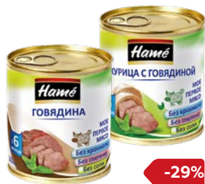
Пюре мясное** ХАМЕ , цыпленок/ курица-говядина/ говядина, 100 г