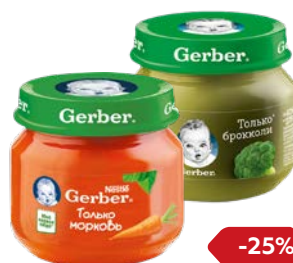
Пюре** ГЕРБЕР , Цветная капуста/ Морковь/Брокколи, 80 г