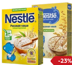
Каша безмолочная** НЕСТЛЕ , Рисовая/Овсяная, 200 г