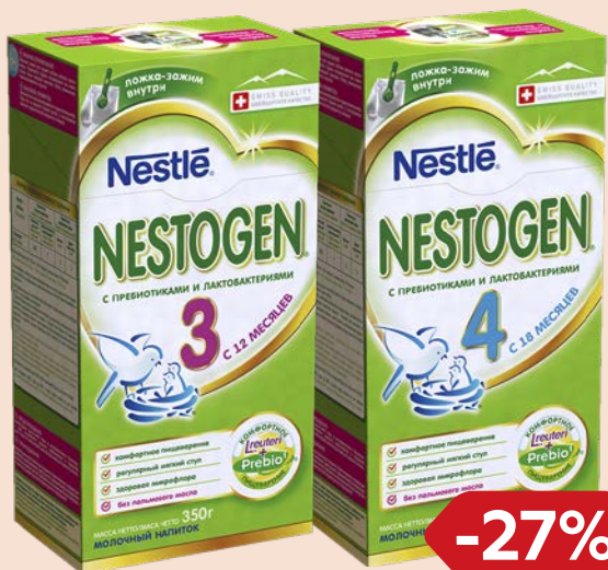
Молочко детское** НЕСТОЖЕН , сухое: 3/4, 350 г