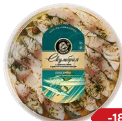
СКУМБРИЯ филе в масле, с пряно- стями 180 г