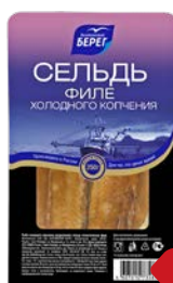
Сельдь БАЛТИЙСКИЙ БЕРЕГ, атлантическая, филе холодного копчения, 250 г