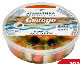
Сельдь АТЛАНТИКА, филе кусочки в масле, ассорти, 400 г