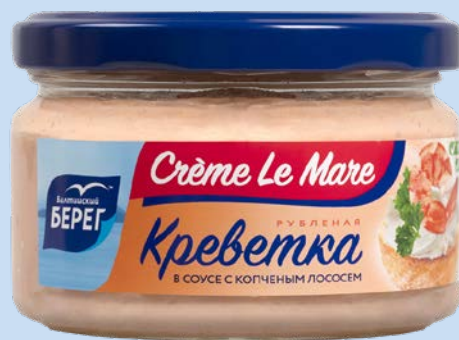
Креме ля Марэ БАЛТИЙСКИЙ БЕРЕГ Креветка рубленая в соусе с копченым лососем, 165 г