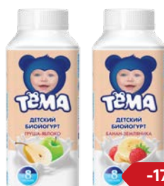
Био-йогурт питьевой** ТЕМА , В ассортименте***, 210 г