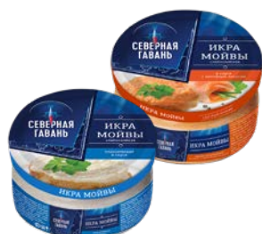
Икра мойвы СЕВЕРНАЯ ГАВАНЬ, Классиче- ская/ С копченым лососем, 180 г