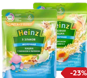
Каша молочная** ХАЙНЦ , 5 злаков, яблоко-банан/ пшеничная с тыквой/ овсяная с персиком, 200 г