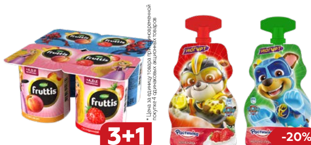
Продукт йогуртный ФРУТТИС герои: Персик / Клубника 2,5%, 110 г