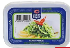
Салат из морских водорослей вакаме ОКЕАН ВКУСА, Чука, 250 г