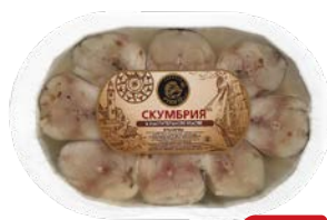
Скумбрия ЗОЛОТАЯ ФИШКА, кусочки в масле, 500 г