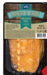
Эсколар БАЛТИЙСКИЙ БЕРЕГ, холодного копчения, набор к пиву, 200 г