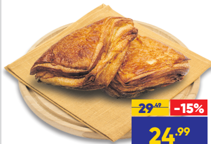
КОНВЕРТИК С ВИШНЕВОЙ НАЧИНКОЙ, 70 г