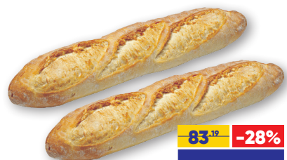
БАГЕТ ТРУАЖ, 200 г