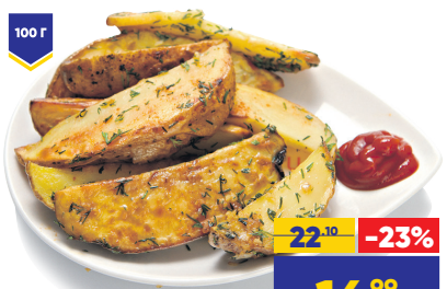
КАРТОФЕЛЬ АЙДАХО, весовой