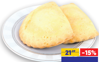
СОЧНИ С ТВОРОГОМ, 45 г