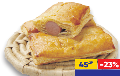
СЛОЙКА С СОСИСКОЙ, 85 г