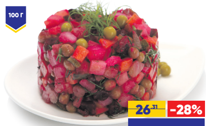
САЛАТ ВИНЕГРЕТ КЛАССИЧЕСКИЙ, весовой