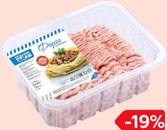
Фарш ДАЛЬНИЕ ДАЛИ , Из свинины (Агро-Белогорье), 700 г