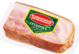
Грудка ОХОТНИЧЬЯ , Варено-копченая (Великолукский МК), 300 г