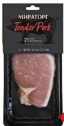
Стейк КЛАССИК , Тендер порк, из свинины (Мираторг), 200 г

* Цена за единицу товара при одновременной покупке 2 одинаковых акционных товаров