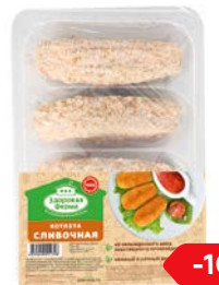
Кнелта ЗДОРОВАЯ ФЕРМА сливочная, охлажденная, 400 г