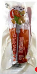
КАРПАЧЧО , из курицы сырокопченное (ООО Копченое), 300 г