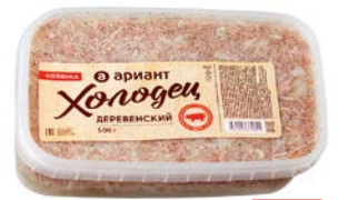
Холодец ДЕРЕВЕНСКИЙ (Ариант Агро), 500 г