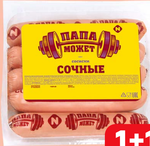
Сосиски ПАПА МОЖЕТ , Сочные (ОМПК), 450 г