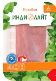
Филе грудки индейки ИНДИЛАЙТ охлажденное, 500 г