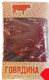
Говядина МЯСНАЯ КАСТА Шейная часть без кости, охлажденная, 500 г