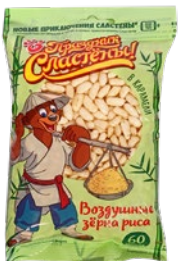
Рис воздушный ПРАЗДНИК СЛАСТЕНЫ, в карамели, 60г