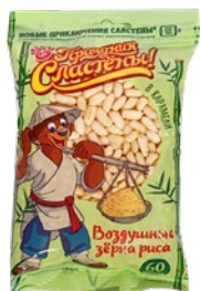
Рис воздушный ПРАЗДНИК СЛАСТЕНЫ, в карамели, 60г