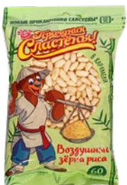
Рис воздушный ПРАЗДНИК СЛАСТЕНЫ, в карамели, 60г