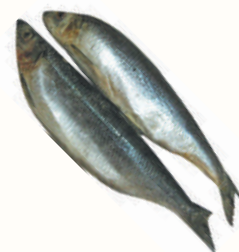
СЕЛЬДЬ С/М, 1 КГ