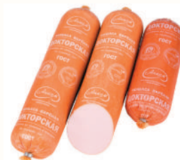
КОЛБАСА "ДОКТОРСКАЯ" АНКОМ, ВАР., 1 КГ