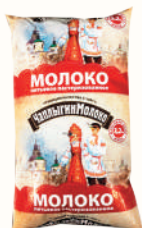
МОЛОКО ПИТЬЕВОЕ 3,2%, 1 Л