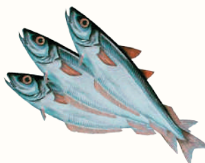
ПУТАССУ С/М, 1 КГ