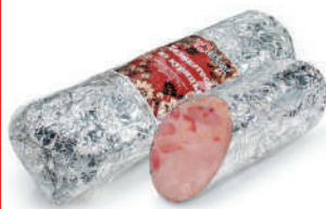
РУЛЕТ "ПРАЗДНИЧНЫЙ ИЗ МЯСА ПТИЦЫ" К/В, ФК ЛАДОГА, 1 КГ