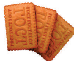
ПЕЧЕНЬЕ САХАРНОЕ "ТОПЛЕННОЕ МОЛОКО", 1 КГ