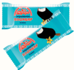
МОРОЖЕНОЕ ПЛОМБИР "СВИТЛОГОРЬЕ" ЭСКИМО ВАНИЛЬНОЕ, 80 ГР