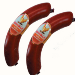
КОЛБАСА "КУРИНАЯ" П/К, СОВАД, 200 ГР