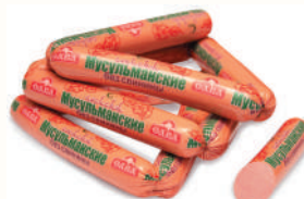
СОСИСКИ "МУСУЛЬМАНСКИЕ" ОХЛ., САВА, 1 КГ