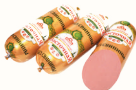
КОЛБАСА "ВОСТОЧНАЯ" ВАР., САВА, 1 КГ