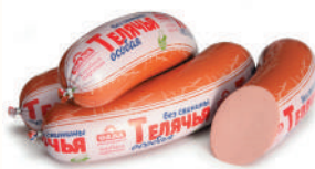
КОЛБАСА "ТЕЛЯЧЬЯ" ОСОБАЯ САВА, ВАР., 1 КГ