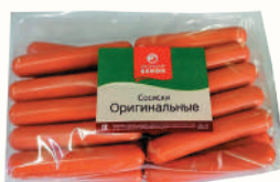
СОСИСКИ "ОРИГИНАЛЬНЫЕ" ОХЛ., ВНМД, 1 КГ