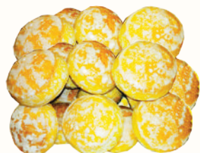
ПРЯНИКИ "С АРОМАТОМ ЛИМОНА", 1 КГ