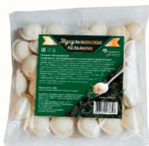
ПЕЛЬМЕНИ "МУСУЛЬМАНСКИЕ" , 350 ГР