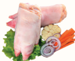
НОГИ СВИНЫЕ С/М, 1 КГ