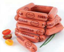
СОСИСКИ "ГОВЯЖЬИ" ОХЛ., АНКОН, 1 КГ