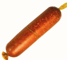
КОЛБАСА "ЗАКУСОЧНАЯ" В/К, ЕВРОКОМ, 1 КГ