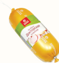
КОЛБАСА "ДОКТОРСКАЯ" НОВИНКА ВАР., ВНМД, 400 ГР Продажа только на Косыгина, 21