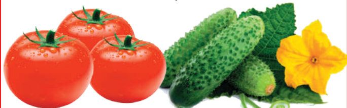
ТОМАТЫ и ОГУРЦЫ