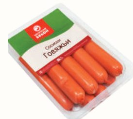
СОСИСКИ "ГОВЯЖЬИ" ОХЛ., ВНМД, 500 ГР