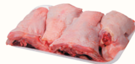
СУПОВОЙ НАБОР КУРИНЫЙ ОХЛ., 1 КГ