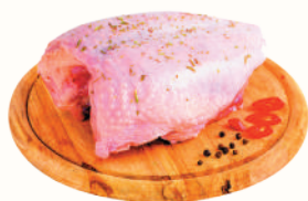
ГРУДКА ЦЫПЛЕНКА ОХЛ., 1 КГ