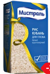
Рис МИСТРАЛЬ , Кубань, кругло- зерный для плова, 900г