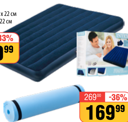
КОВРИК ТУРИСТИЧЕСКИЙ ЭВА , 50 х 180 см (арт. 0468277)