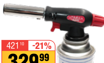
ГОРЕЛКА ГАЗОВАЯ с пьезоэлектрическим розжигом (арт. 4-048,4-042)