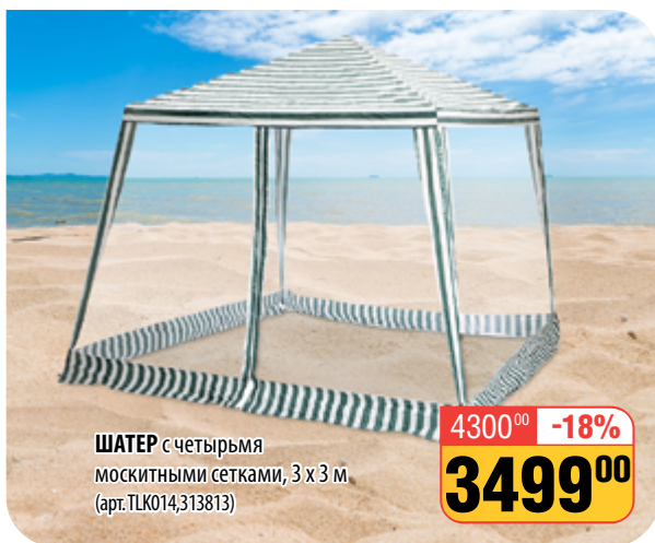
ШАТЕР с четырьмя москитными сетками, 3 х 3 м (арт. TLK014,313813)