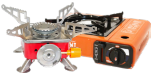
ПЛИТА ГАЗОВАЯ: - «Следопыт-Classic» настольная - Energy GS-200 портативная