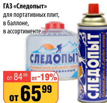
ГАЗ «Следопыт» для портативных плит, в баллоне, в ассортименте