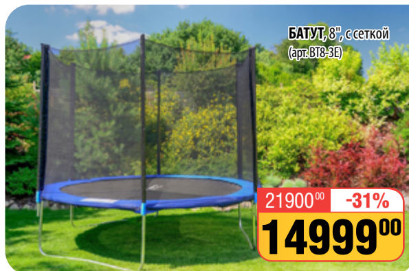
БАТУТ , 8", с сеткой (арт. BT8-3E)