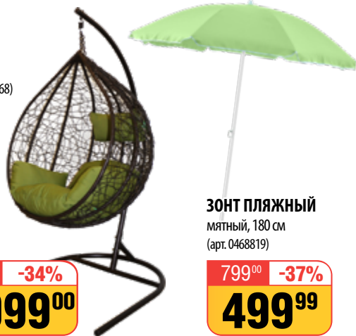
ЗОНТ ПЛЯЖНЫЙ мятный, 180 см (арт. 0468819)