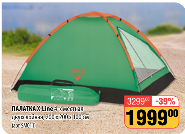
ПАЛАТКА X-Line 4-х местная двухслойная, 200 х 200 х 100 см (арт. SM011)