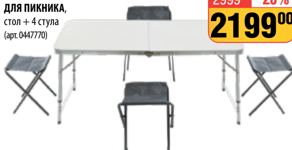
НАБОР МЕБЕЛИ ДЛЯ ПИКНИКА , стол + 4 стула (арт. 0447770)