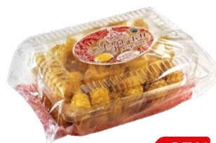
Восточные сладости ВКУСОТЕЕВЪ Язычки медовые, с кунжутом, 500 г