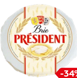
Сыр бри ПРЕЗИДЕНТ, молодой (Ровеньки-МСЗ), 100 г