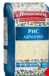
Рис НАЦИОНАЛЬ , Адриатика, 900 г