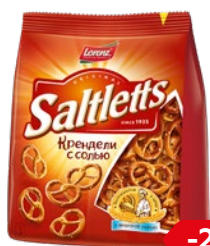
Крендель СОЛТЛЕТС , с солью (Лоренц), 150 г