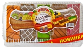
Пирожные АКАДЕМИЯ ВКУСА , ассорти, к чаю, 390 г