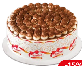
Торт ТИРАМИСУ , Усладов (Хлебпром), 700 г