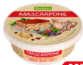
Сыр МАСКАРПОНЕ, Бонфесто, 250 г