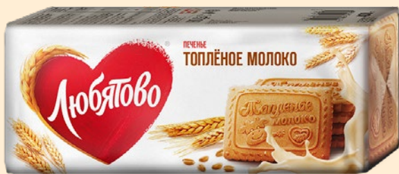
Печенье ЛЮБЯТОВО , Топленое молоко, 400 г