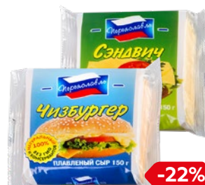
Сыр плавленый ПЕРЕЯСЛАВЛЬ Чизбургер/Сэндвич, 150 г