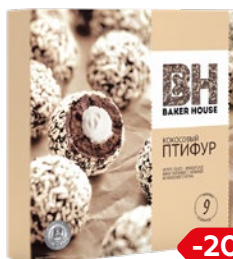
Пирожное ПТИФУР кокосовый крем, 225 г