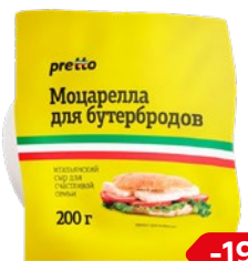
Сыр ПРЕТТО Моцарелла для бутербродов, 200 г