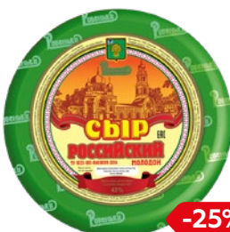
Сыр РОССИЙСКИЙ, молодой (Ровеньки-МСЗ), 100 г