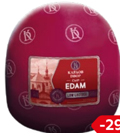
Сыр ЭДАМ (Карлов Двор), 100 г