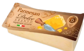
Сыр ПАРМЕЗАН Дольче, 200 г