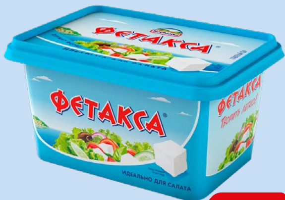
Сыр ФЕТАКСА Хохланд, 400 г