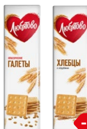
ЛЮБЯТОВО , Хлебцы с отрубями/ Галеты классические, 185 г