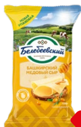
Сыр БАШКИРСКИЙ медовый (Белебеевский МК), 220 г