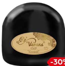
Сыр РЕВЕРАНС, Карлов Двор, из козьего молока, (Ровеньки МСЗ), 100 г