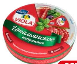
Сыр плавленый ВИОЛА Ассорти итальянское, треугольники, 130 г