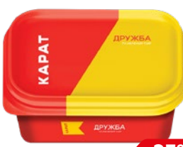
Сыр плавленый КАРАТ, Дружба, 400 г