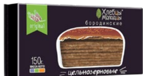
ХЛЕБЦЫ МОЛОДЦЫ , Хрустящие бородинские, цельнозерновые, 150 г