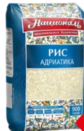
Рис НАЦИОНАЛЬ , Адриатика, 900г