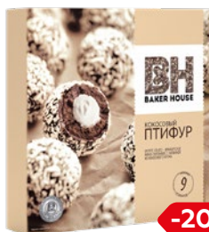
Пирожное ПТИФУР кососовый крем, 225 г