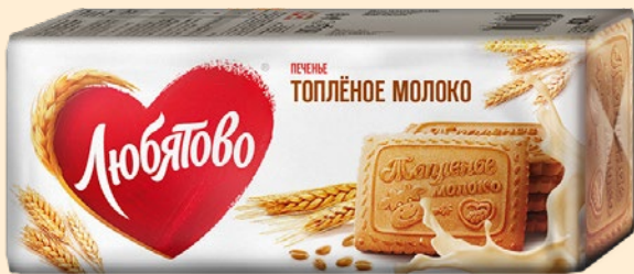
Печенье ЛЮБЯТОВО, Топленое молоко, 400 г