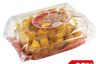
Восточные сладости ВКУСНОТЕЕВ Язычки медовые, с кунжутом, 500 г