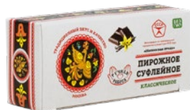
Пирожное МОСКОВСКАЯ ПТИЦА классическое, 75 г