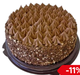
Торт ТРЮФЕЛЬНЫЙ (Академия Вкуса), 630 г