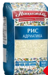
Рис НАЦИОНАЛЬ , Адриатика, 900 г