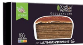
ХЛЕБЦЫ МОЛОДЦЫ, Хрустящие бородинские, цельнозерновые, 150 г