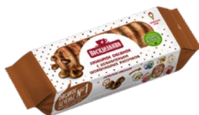
Печенье ПОСИДЕЛКИНО, овсяное, с кусочками шоколада, 310 г