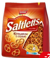
Крендель СОЛТЛЕТС, с солью (Лоренц), 150 г