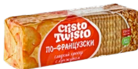
Крекер КРИСТО-ТВИСТО, по-французски, сладкий с кунжутом, 168 г